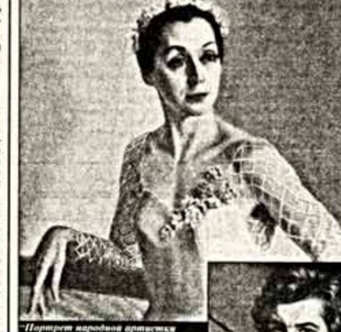
Портрет народной артистки СССР Н. Тимофеевой, 1974 г.