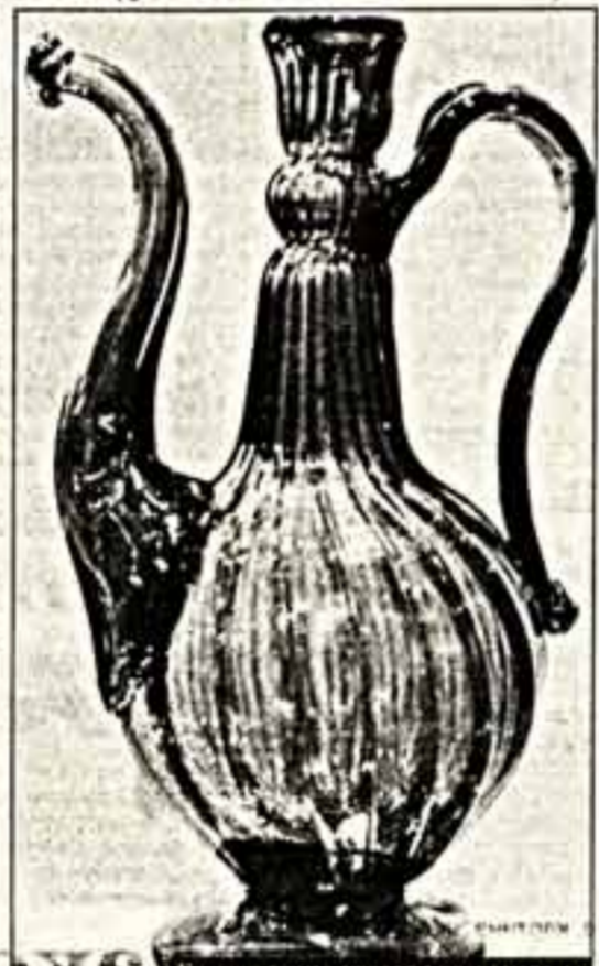
Кувшин с выемками. XVIII—XIX вв.

Русский раздел экспозиции — наиболее основательный. Старейший здесь — кубок, украшенный привлекательной надписью: "Виват, царь Петр Алексеевич". Затем идут бокалы, стопки, кубки, графини, изящнейшие рюмки и совсем миниатюрные, вероятно, дамские рюмочки, стаканы эпохи Елизаветы Петровны, Екатерины II, Александра I. Высший свет Российской империи