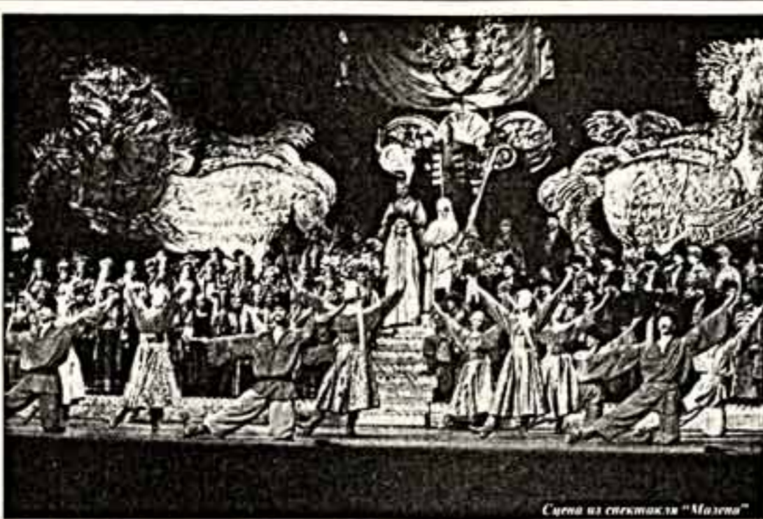
Сцена из оперы "Мазепа"