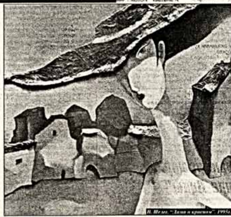
В. Шенгел, "Тали в кривизне" 1995г.