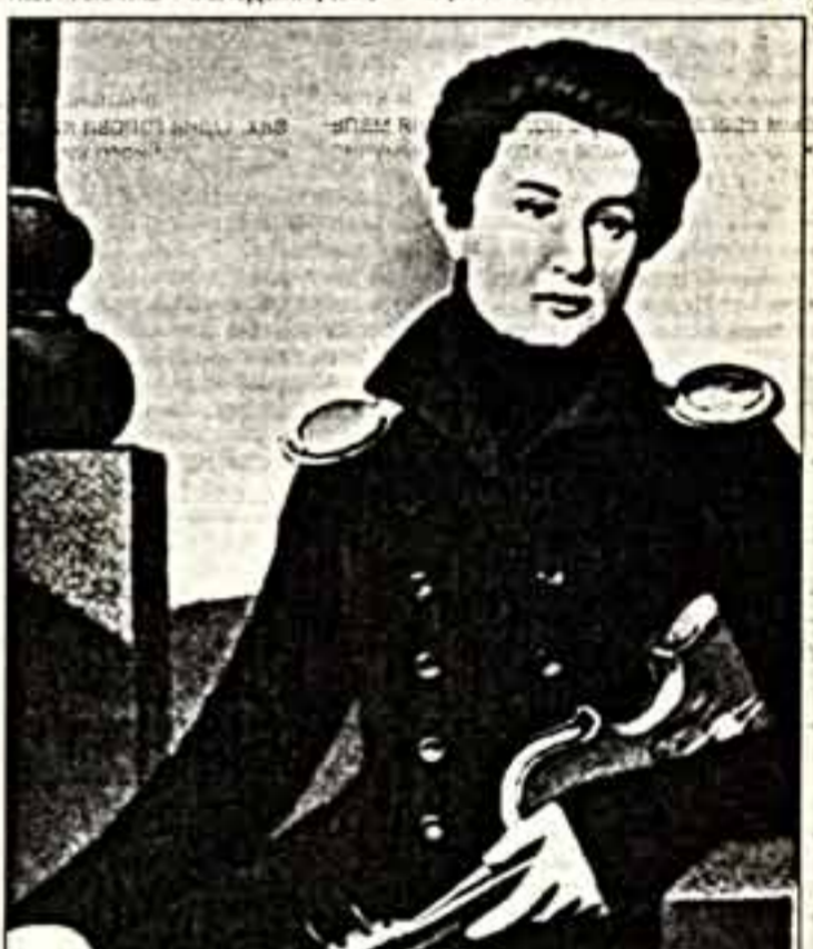
А.Ф.Львов. Портрет А.Ф.Львова. 1821 г.

Кого же он изобразил в 1823 году? Человека необыкновенного, выдающегося. Это Алексей Федорович Львов. Скрывшийся от преследований Аракчеева, сделав стремительную карьеру. Генерал сента императора, флигель-адъютант, тайный советник, гофмейстер, кавалер высших орденов Российской империи. Но прославился Львов — чем и остался в истории русской культуры — как талантливый дирижер, композитор (кстати, автор музыки гимна "Боже, царя храни"), директор придворной певческой капеллы, подымавшей, по отзывам современников, до высшего художественного уровня русское хоровое пение. Но прежде всего — выдающийся скрипач, пользовавшийся европейской славой. "Львов — редкий, исключительный артист, — писал Р.Шуман. — Его музыка так оригинальна, глубока, искренна, свежа, исходит как бы из иных сфер". Не было известного иностранного музыканта, который, будучи в Петербурге, не стремился бы услышать игру Львова,