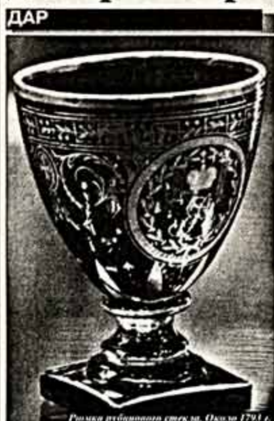
Рюмка пробитного стекла. Около 1794 г.