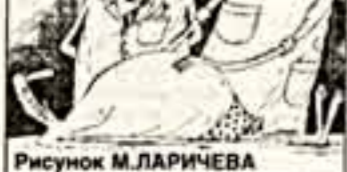
Рисунок М. ЛАРИЧЕВА

По мнению министра, такой выход есть. На Пироговском съезде медикам предстоит обсудить "Концепцию развития российского здравоохранения".