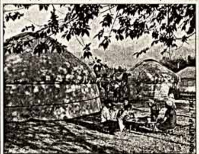
По сообщениям корреспондентов ИТАР-ТАСС и соб. инф.

Самые кардинальные демографические изменения произошли в немецкой диаспоре. В результате массового отъезда в Германию немцев в Казахстане стало в три раза меньше. Теперь