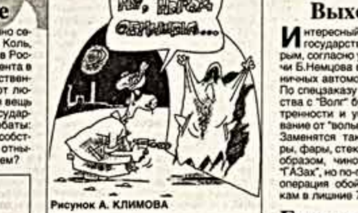
Рисунок А. КЛИМОВА