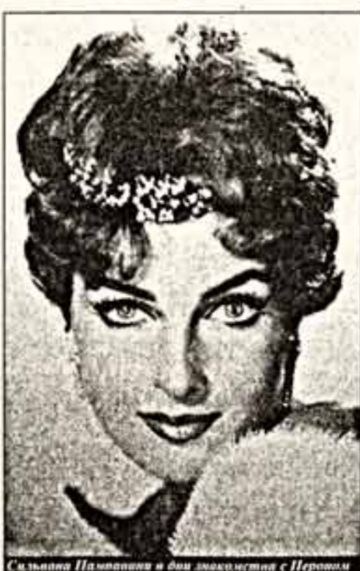
Сильвана Пампанини в дни знакомства с Пероном

Дело было так. В пятидесятых годах, когда Сильвана блистала на экранах Европы, фильмы с ее участием проходили по Южной Америке и там с огромным успехом. В разгар европейской зимы мне предложили участвовать в кинофестивале в Буэнос-Айресе, — рассказывает Пампанини, которой недавно исполнилось 71 год. — Телеграмма была прислана от имени Перона. Аргентина тогда всячески старалась создать себе имидж высококультурной державы, и на фестивале были приглашены самые известные "звезды" мирового кино. Буэнос-Айрес встретил меня торжественно. Может быть, не так, как Каракас — помню, к моему приезду президент страны распорядился украсить все городские автобусы флажками с моим изображением. Но в Буэнос-Айресе меня встречала большая толпа поклонников и еще министр иностранных дел — его пригласил Перон. Мне отели роскошные апартаменты в одном из лучших отелей столицы, возили в шикарном лимузине, который сопровождал эскорт мотоциклистов. Перон дал прием в мою честь, и вот в впервые увидела этого знаменитого человека. Высокий, с густо зачесанными на пробор волосами, очаровательно любезный. И в штатском — за все время моего с ним знакомства никогда не видела его в военной форме. "Ах, Сильвана, — сказал он мне, — я очень люблю Италию, ведь я служил там — в частях альян-