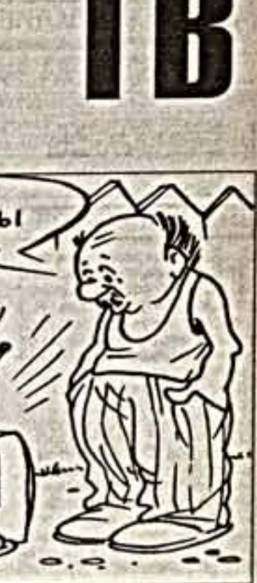
Рисунки А. ШАХГЕЛДЯНА

НТВ 8.00, 10.00, 12.00, 14.00, 16.00, 19.00, 22.00, 0.00 Сегодня 10.15 Утро 10.30 ХИТ "ПРО ВИТЮ, ПРО МАШУ И МОРСКОЮ ПЕХОТУ"