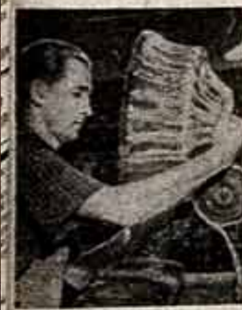
Идея дитяческих кружков является широко популярной. На Бродвейской выставке Детского искусства в Нью-Йорке в 1954 году в возрасте 10 лет Рабинвичем Гассом

лучших артистических сил и художественных коллективов страны, и настойчивая необходимость всемерной активизации межреспубликанского обмена художественными ценностями, и задача значительно более широкого использования для пропаганды лучших образцов музыкального искусства современных технических достижений в области звукозаписи, кино, радио, телевидения.