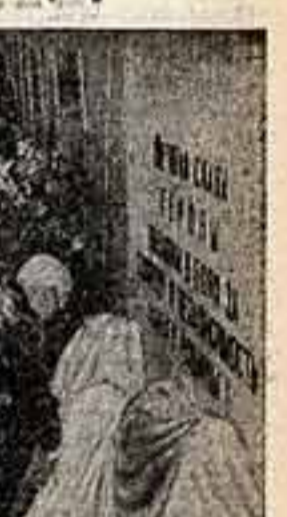
Торжественное открытие в Центральном доме кино мемориальной доски работникам фронтальных съемочных групп, погибшим во время Великой Отечественной войны 1941—1945 годов.

«Мы склоняем здесь головы перед светлой памятью наших товарищей», — сказал он, — навеки запечатлелись эпизоды героической борьбы советского народа. ...Под звуки Государственного гимна Союза ССР медленно спу-