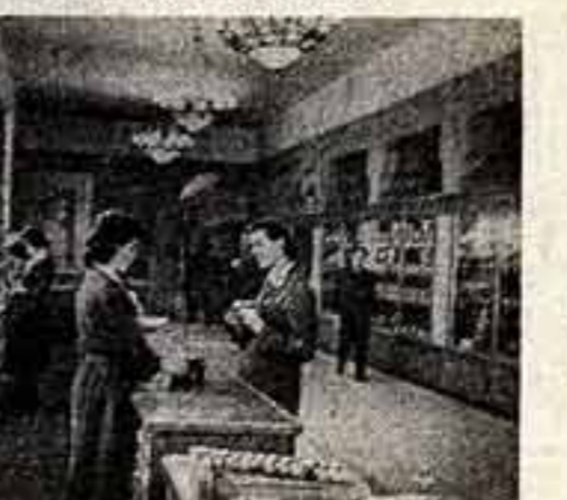
В Москве на Ленинском проспекте открылся новый магазин «Кинолюбитель». Здесь оператор-любители смогут приобрести все необходимое для киносъемки, но также обработать снятую пленку и просмотреть на экране киноленту результаты своего творчества. В новом магазине также открыт фотоаппарат, где можно получить любую консультацию по вопросам фотографии и получить великий ремонт фотоаппаратов. На снимке: в одном из отделов нового магазина.

В этом вузе организовано 10 концертных бригад, которые знакомят слушателей с творчеством композиторов классиков и советских авторов. Только в 1959 году музыканты консерватории дали более 50 концертов в столице и области, в которых участвовало 307 исполнителей. Они выступали на фабриках «Вуревский», «Свобода», на Высоковской придельной фабрике, в колхозах имени Горького, «Путь новой жизни», Калининского района Московской области. Сейчас консерватория организует вечера в честь выборов на