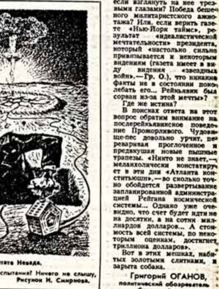
На полгоне в штате Невада. Чо! Превратить ядерные испытания! Ничего не слышу, тут не так шумно...