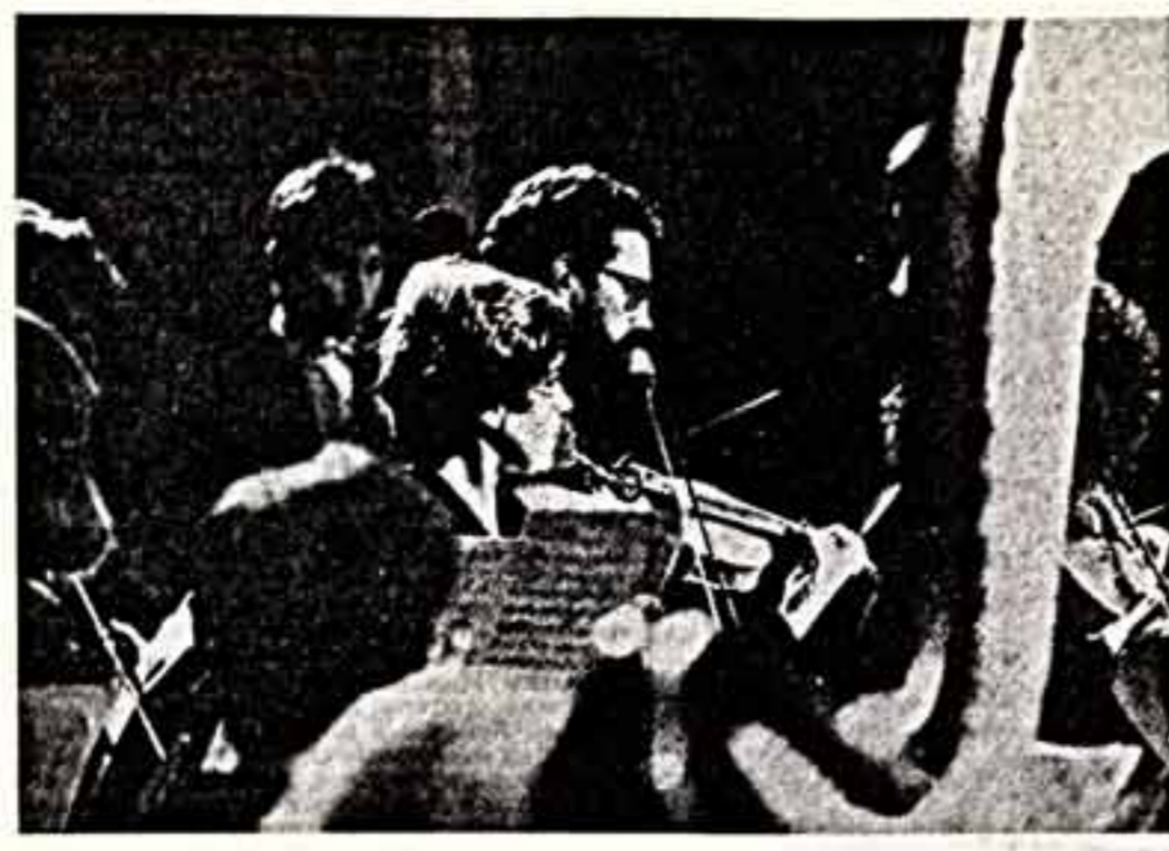
В филармонической зале Кабинеты по-особому празднично, когда здесь выступает с концертами симфонический оркестр кабайнского народного оперного театра...