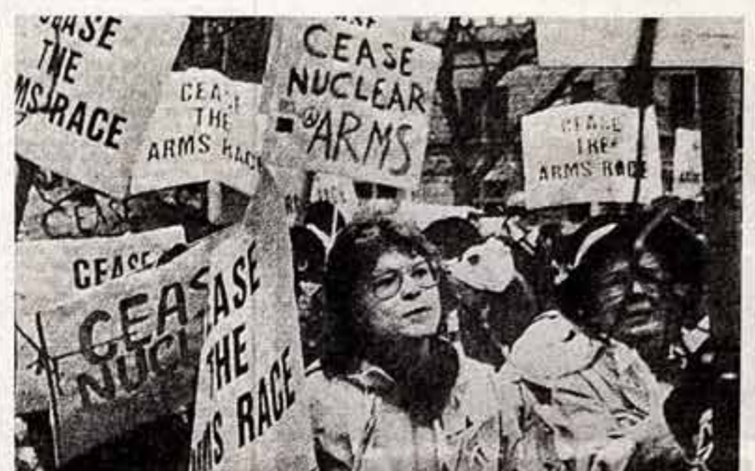
Для сохранения жизни на земле, для упрочения мира на планете нужно усилить борьбу против американских ракет, против курса администрации Рейгана на подписание пакта о нераспространении ядерного оружия.

В 7 раз больше, чем на территории ЮАР, совершаются набеги на деревни намибийцев.