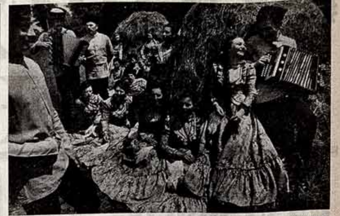
Этот лауреат первого Всесоюзного фестиваля самодельного народного творчества получил диплом ВДХ СССР, участия Дней советской культуры в Бельгии — ансамбль кубанской народной песни города Тихорецка «Родные напевы».

Этот был жадный, снятые в Тегеране во время крушеющей антиамериканской демонстрации, для традиционной воскресной телепрограммы «Международная ланч-репортаж». На минувшей неделе международная тема была одной из важнейших в информационном выпуске телевидения, в программе «Враги», в других передачах. Как слышит мир от ядерного базиса, от зловещей угрозы войны, от нагнетанной империалистическими кругами атмосферы страха и недоверия — эти вопросы сегодня стали самыми актуальными для человечества, и мощное антиамериканское движение захватывает все более широкие слои населения всех стран.