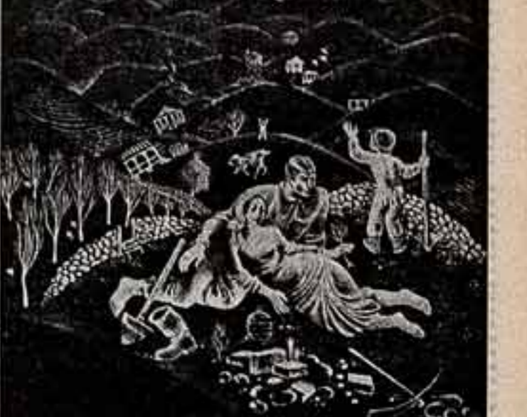
Э. Делсадзе. «Мир».