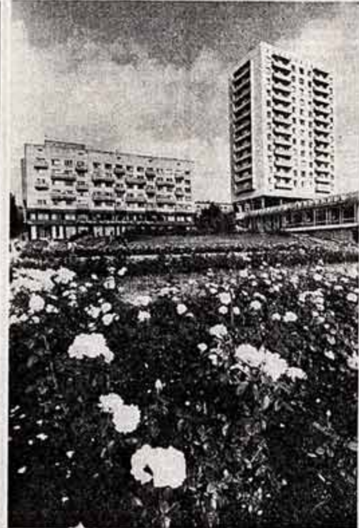
Город Донецк — крупнейший центр угольной промышленности, металлургии и машиностроения — широко известен в нашей стране и за ее пределами. Красота улиц и площадей, обилие зелени и цветов, чистота — результат коллективного труда всех жителей Донецка.