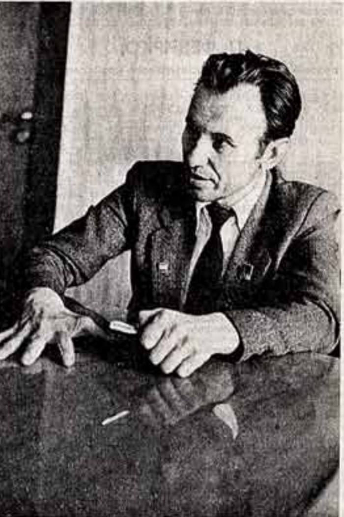
Владимир Ишанян — лауреат Государственной премии СССР «Самое главное, самое ценное богатство нашего города — это, конечно, его замечательные люди. Красота улиц и площадей, обилие зелени и цветов, чистота — результат коллективного труда всех жителей Донецка».