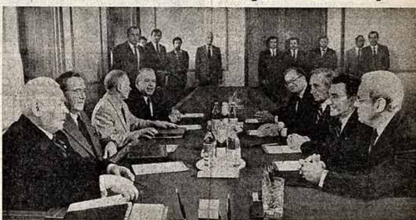
Во время беседы.

13 июля Генеральный секретарь ЦК КПСС, Председатель Президиума Верховного Совета СССР К. У. Черненко принял в Кремле Генерального секретаря ООН Х. Переса де Куэльера, находившегося в Советском Союзе с официальным визитом. В беседе приняла участие член Политбюро ЦК КПСС, первый заместитель Председателя Совета Министров СССР, министр иностранных дел СССР А. А. Громыко.