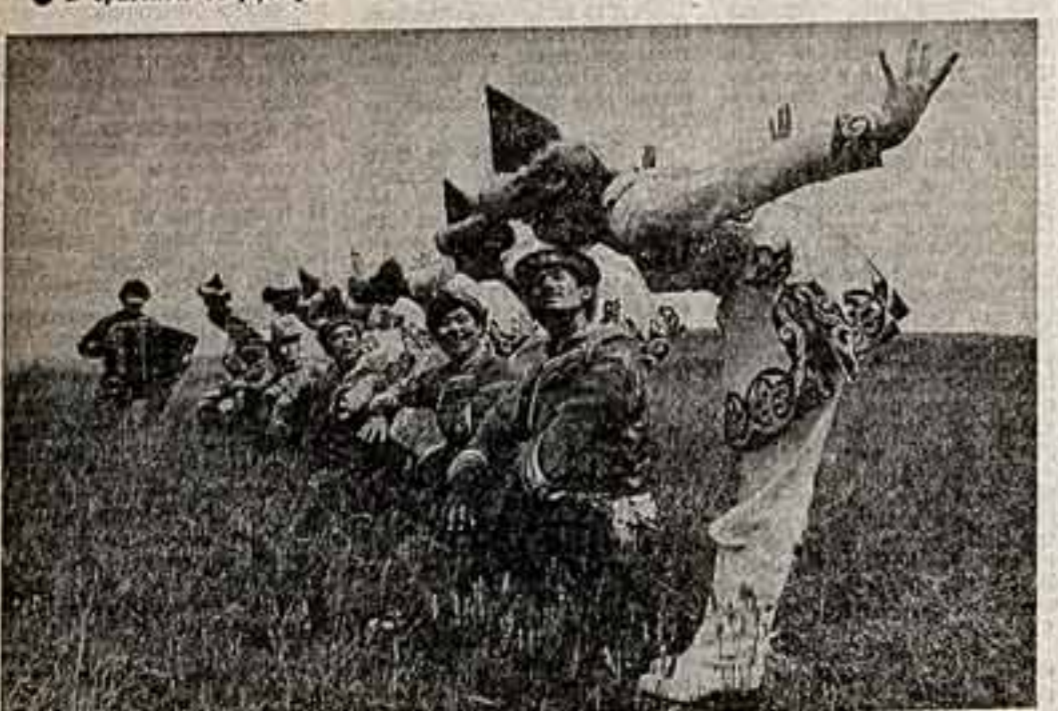
Возле народных талантов Иркутская земля. Нет такого жарка в искусстве, в котором не выступали бы самобытные артисты. В братской дворце культуры