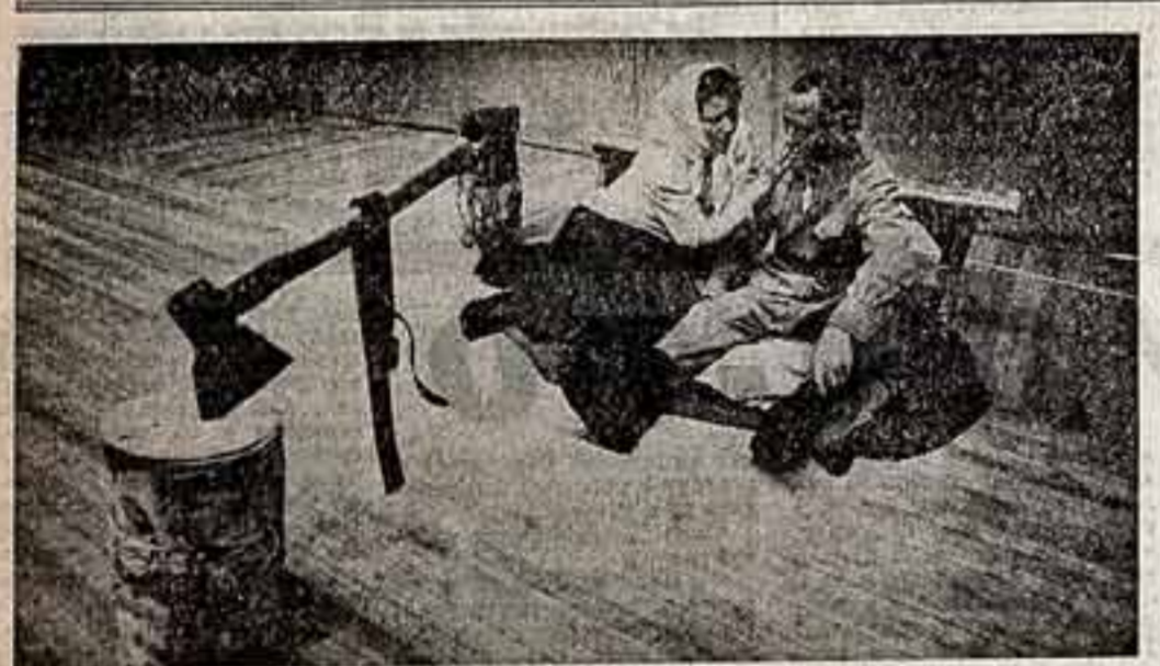
Возле народных талантов Иркутская земля. Нет такого жарка в искусстве, в котором не выступали бы самобытные артисты. В братской дворце культуры