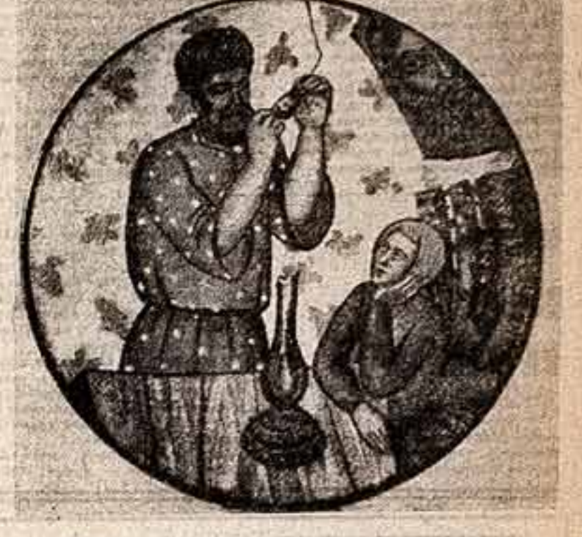
Н. Коновалов. «Апалочка Ильича» (керамика). Ленинград.

КАК ЧАСТО МЫ СЛЫШИМ: нужны сувениры! Неоткуда руководители производства убежденно говорят о необходимости строительства заводов для выпуска сувениров. Выставка предлагает для нас