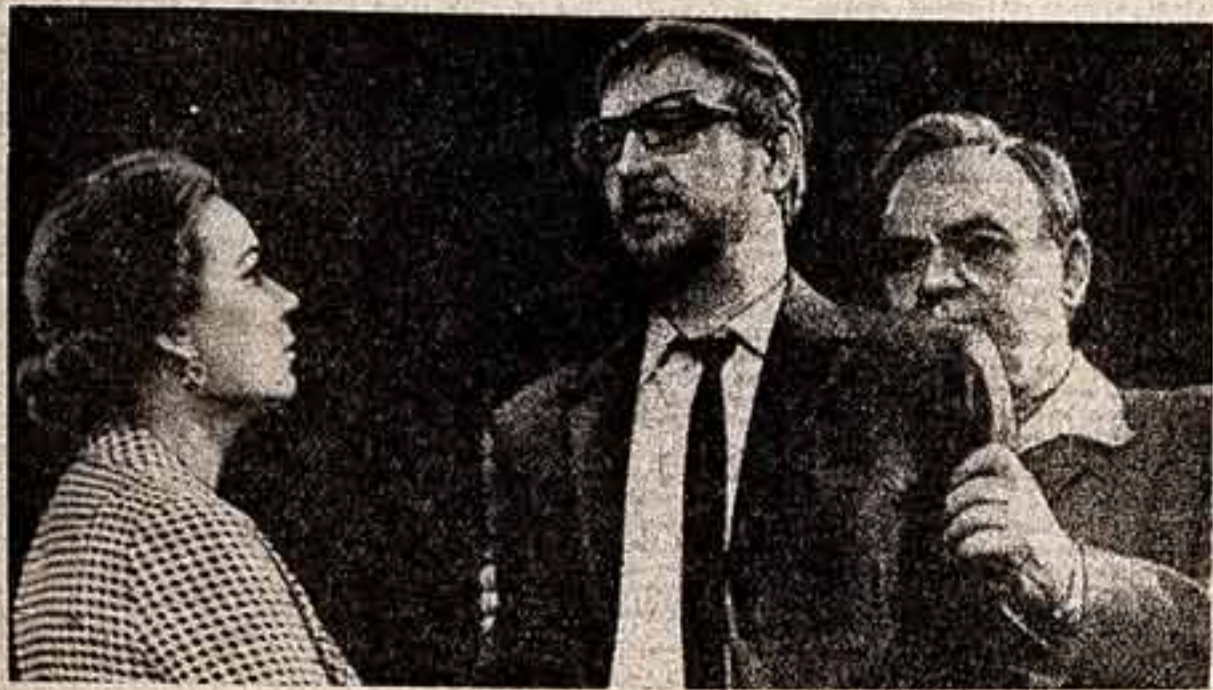
Московский театр имени М. Н. Ермоловой

показала новую спектакль-комедию лауреата Ленинской и Государственной премии СССР Леонида Леонова «Обыкновенный человек».