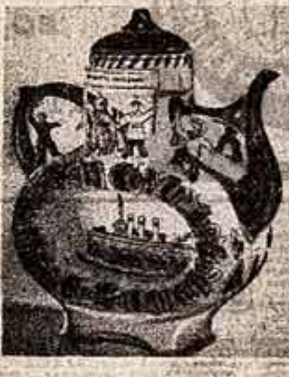
П. Азарова. Декоративный сосуд «Зал Авроры». Гельс.

Спелит кружева — добрый подарок зрителю в канун столетия со дня рождения великого Ленина.