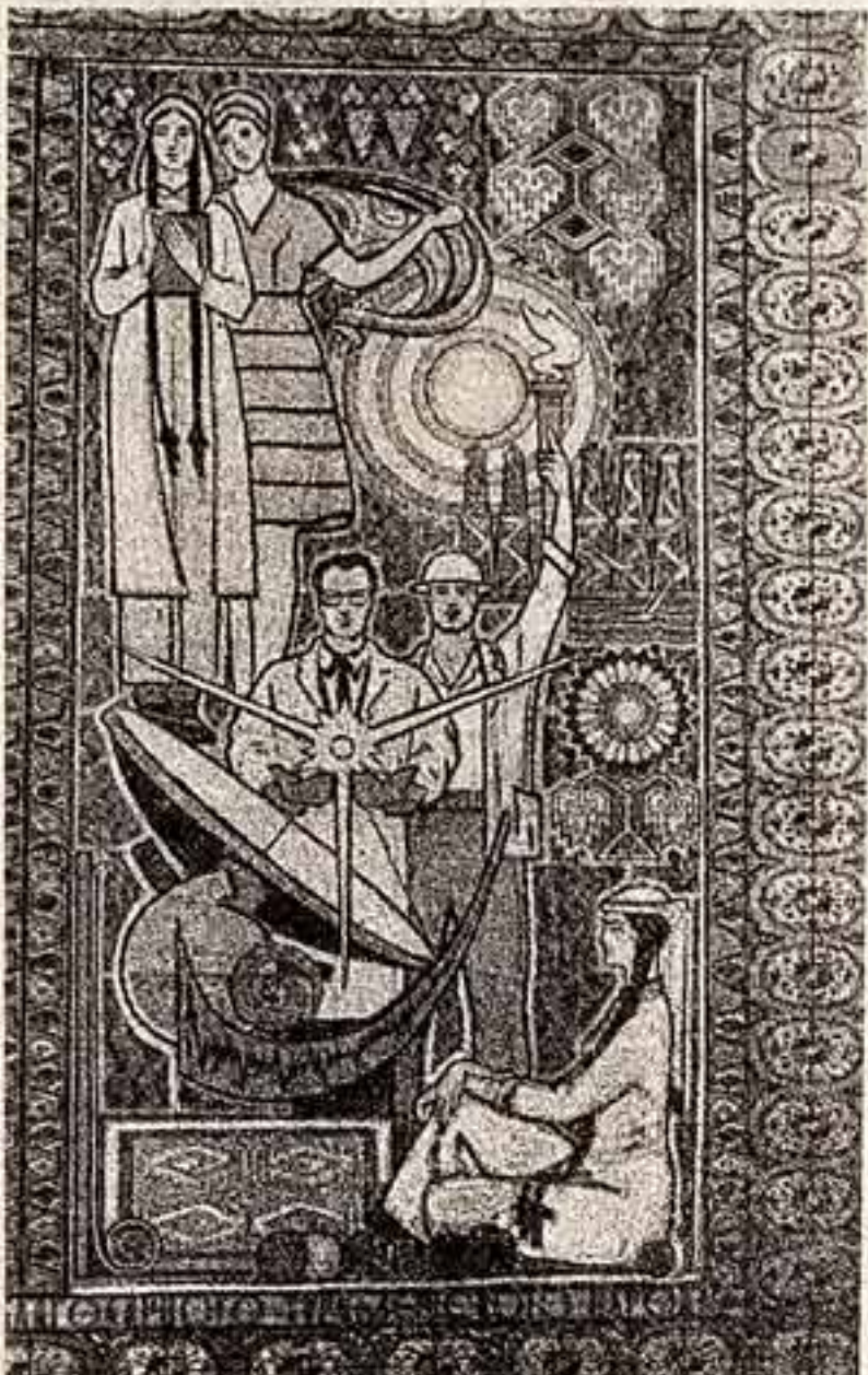
На Ашхабадской художественной экспериментальной киностудии закончено изготовление порам-панно для мемориальной книги В. И. Ленина в Ульяновске.