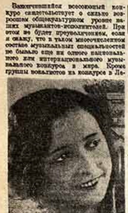
Вера Дулова. Лауреат конкурса, получившая первую премию (арфа)

Важнейшим событием в музыкальной жизни нашей страны является конкурс артистов музыкального искусства. Впервые в нашей истории конкурс артистов музыкального искусства проводится в форме всесоюзного конкурса артистов музыкального искусства.