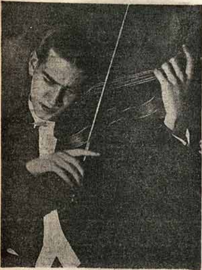
Давид Ойстрах. Лауреат конкурса, получивший первую премию (скрипка)