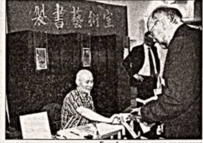
Китай — страна-гость на ярмарке