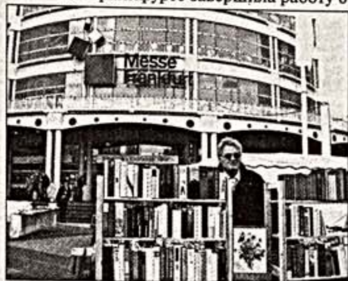
Российский стенд на ярмарке