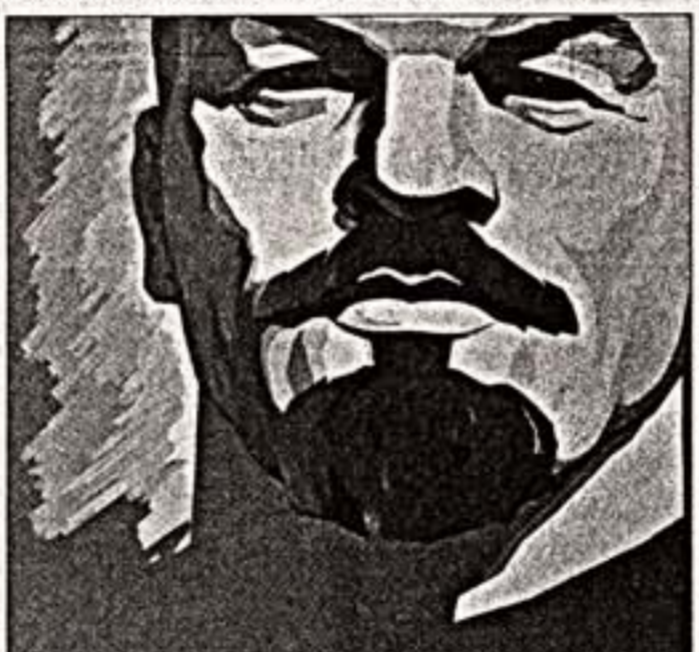
В.Сычев. «Москва. Под Ишимем». 1977 г.