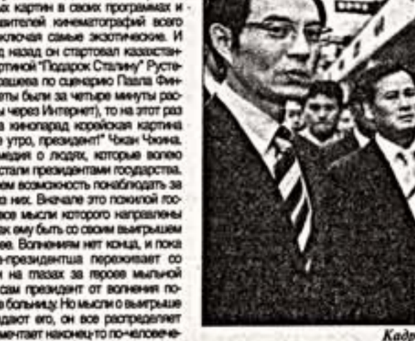
Кадры из фильмов "Доброе утро, президент" (верху) и "Истинный владелец"