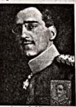
Александр I Карловичевич Европа. Приняв власть взошедшего на престол младшего и двоюродного племянника своего старшего брата Александра II, Александр I Карловичевич начал правление в 1825 году...