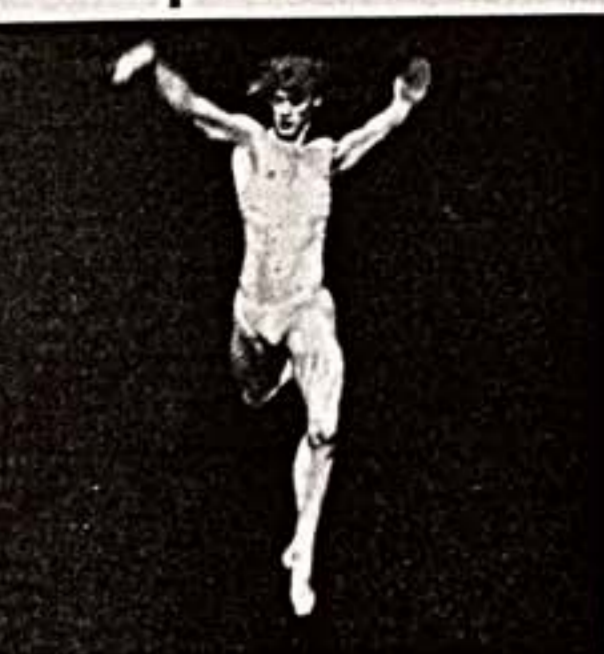
Сцена из спектакля "Весна славянская"