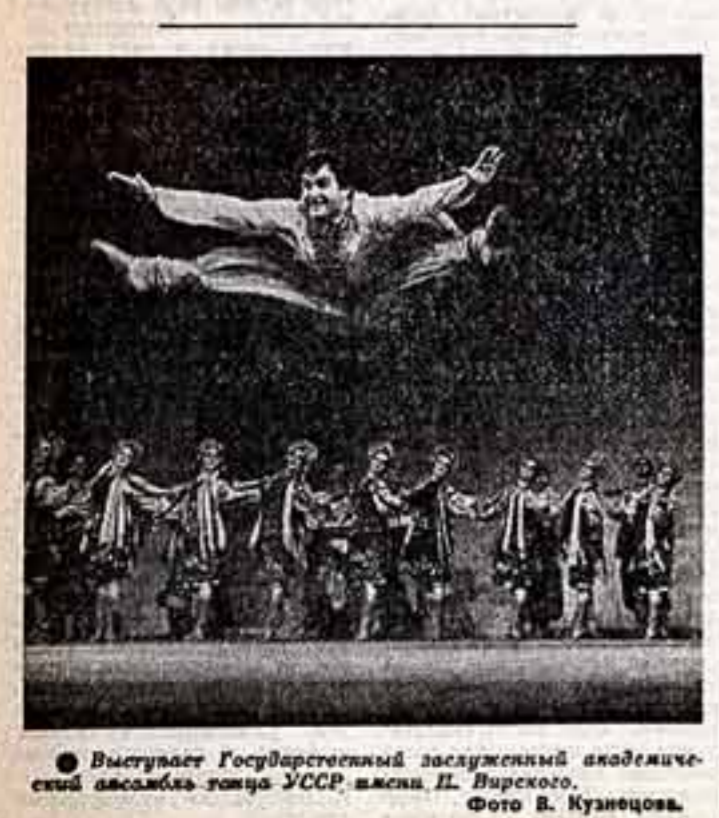
Выступает Государственный заслуженный академический ансамбль танца УССР имени Л. Вурского.