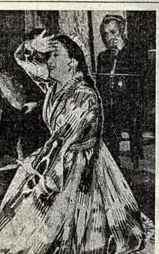
Танцует народная артистка Узбекской ССР Мукаррам Турғубаева.

Эта партия здесь за работой моей Смотри раннего солнца выматывающим оком... О, спасибо за силу и ясность лучей — За солнце, что в сердце — как в небе высоком!