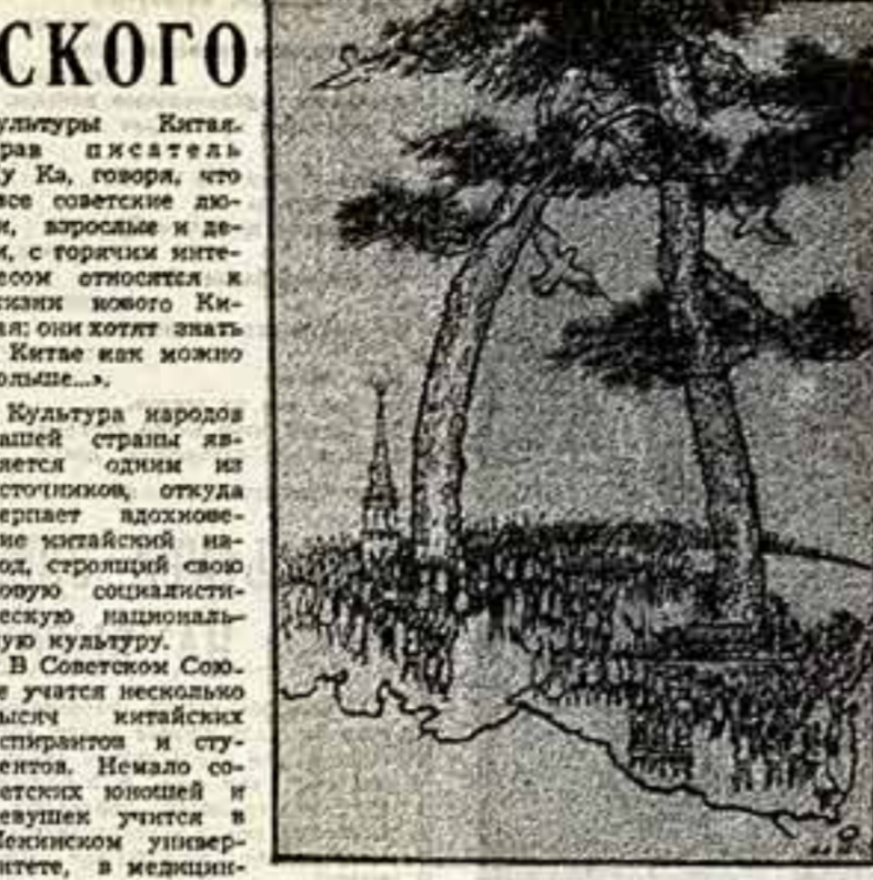
Да здравствует китайско-советская дружба! Рисунок Ю. ДИДА (художественный институт провинции Шанхай). Из газеты «Яньминь шибао».

Советский народ проявляет исключительный интерес к многогранной культуре Китая. Наше население с большим интересом знакомится с китайской архитектурой, литературой, философией, живописью, мы с радостью следим за пыльным расцветом