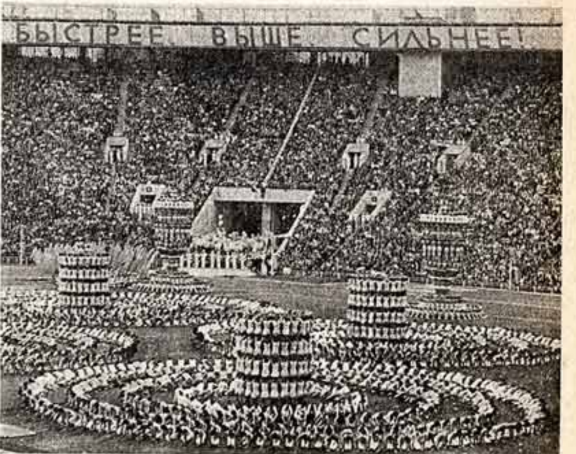
Во время торжественного открытия Игр XXII Олимпиады на Центральном стадионе имени В. И. Ленина.