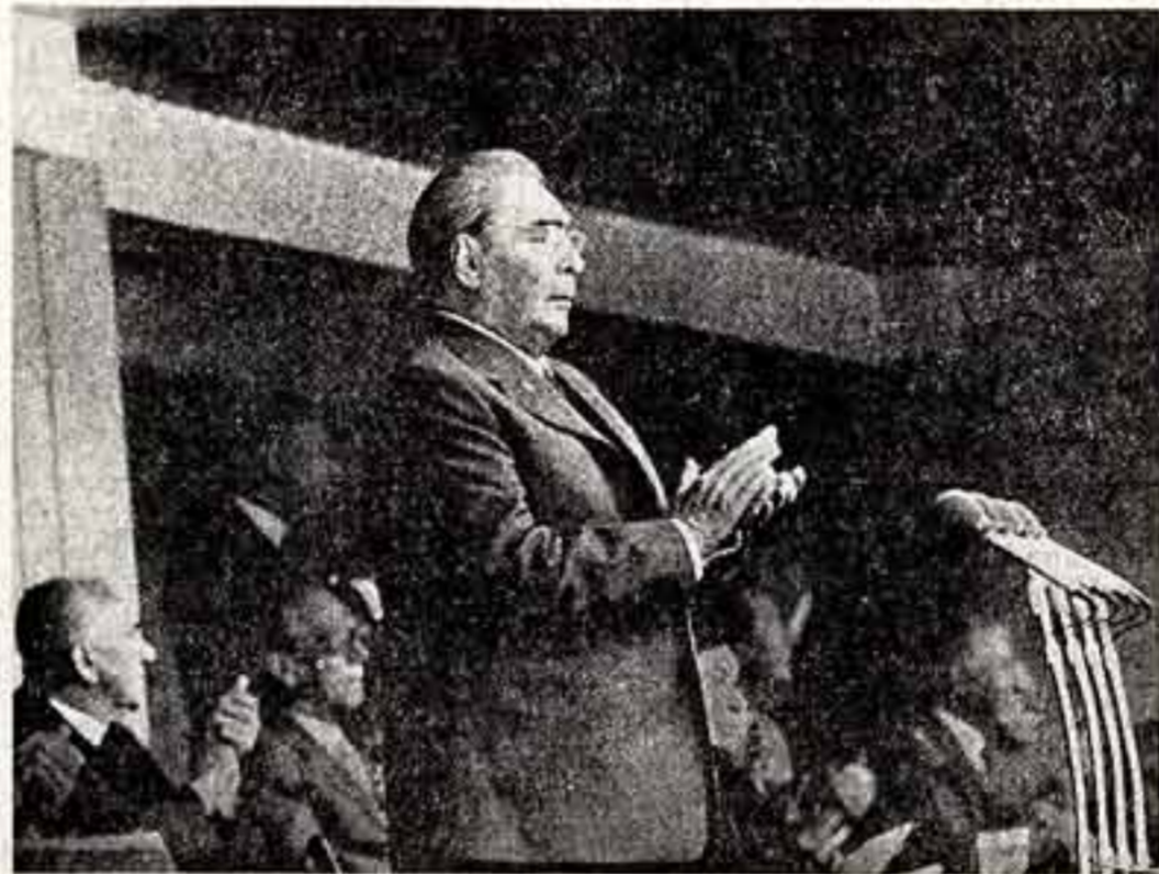
Леонид Ильич Брежнев открывает Игры XXII Олимпиады.

Более часа длится яркий, красочный парад участников — наглядное свидетельство широкой представительности стран и народов на Московской Олимпиаде.