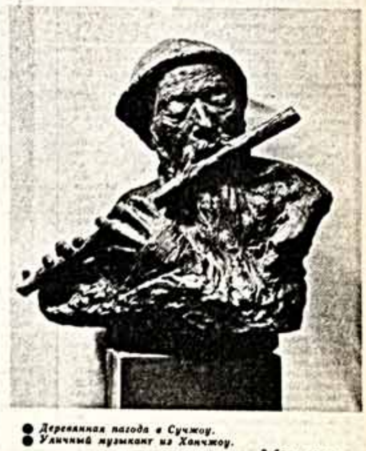
Деревянная пагода в Сучжоу. Уличный музыкант из Ханчжоу. Работы автора.