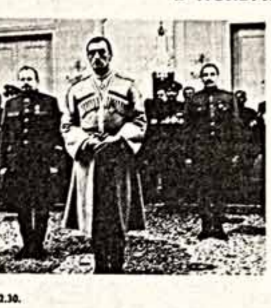
— 1 пр., 22.30.