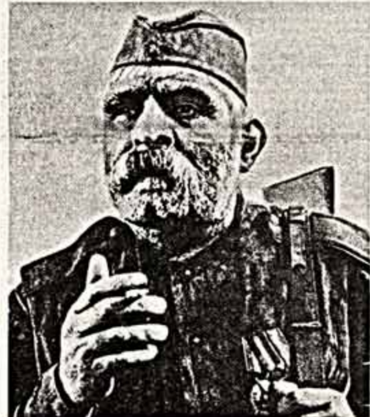
С. Захарядзе («Отец солдата»).

Послевоенные десятилетия начались героическим трудом советских людей. Всю власть была в руках советского народа, в руках советских людей. Это была эпоха великого созидания. Вспомните: послевоенные войны не стало водоразделом в развитии нашей литературы и искусства. Тема героического подвига сынов и дочерей нашего народа, осмысление истоков этого мужества, стойкости, патристического подвига, начавшая в литературе, других видах искусства в тяжкие годы смертельной битвы с фашизмом, была с новой силой продолжена нашими мастерами в послевоенные годы и продолжается до сих пор.