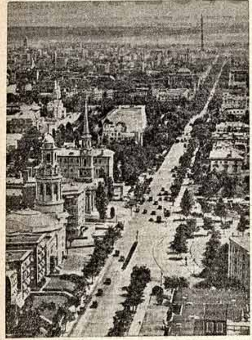
Столица США — Вашингтон.