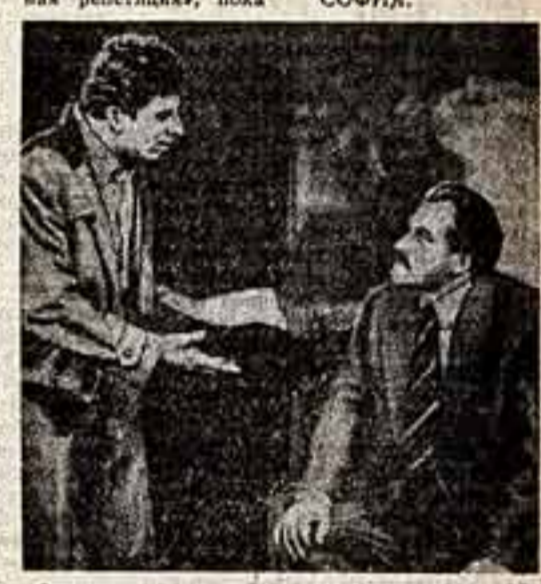
Сцена из спектакля «Незабываемые дни» Стрельцова. (Народный театр имени Кръсто Сарафова)

Под таким заголовком в № 87 (958) «Советской культуры» был опубликован очерк о грубых организационных ошибках в деятельности Свердловского ансамбля. Как сообщают представители Министерства культуры РСФСР в Свердловске, в очерке неправильно освещены вопросы организационно-производственной работы ансамбля. На эти вопросы Министерство культуры РСФСР указало директору Свердловского ансамбля, а также командированным сотрудникам ансамбля, особенно в Москве, в течение их полных творческих поездок в целях закрепления кадров.