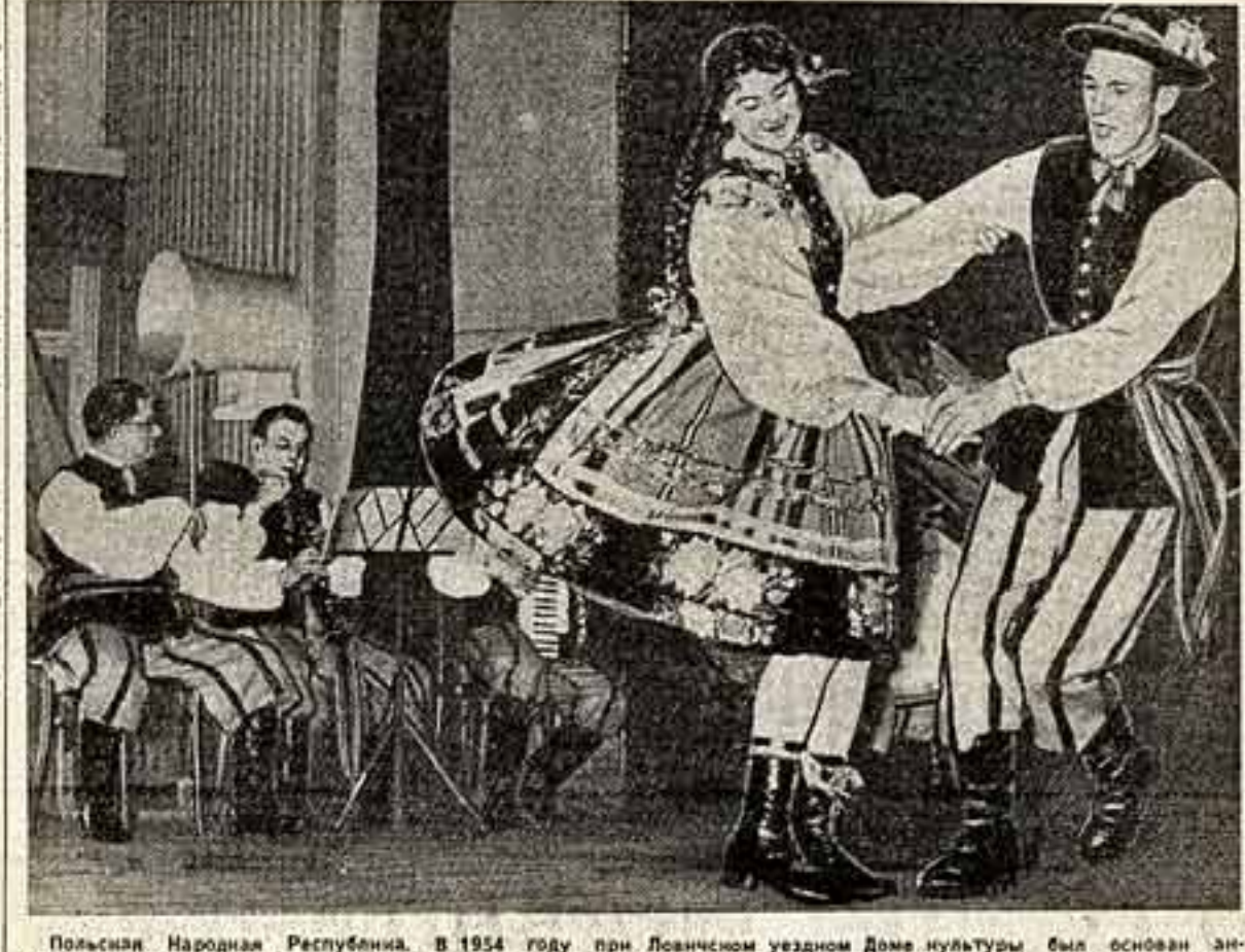
Польская Народная Республика. В 1954 году при Лодзинском узком Доме культуры был основан ансамбль песни и танца. С тех пор на его выступлениях любуются больше полумиллиона зрителей. На снимке участники ансамбля исполняют крестьянский танец.

Каждый выйдет на улицу В этот день каждый выйдет на улицу. Во всех главных наших городах будут проведены большие шествия вооруженных сил. Весь мой народ перемолот счастье, он принимает самое активное участие в национальных праздниках по случаю Дня революции, ибо этот день положил начало новой жизни для него и прекрасного будущего для независимых арабских стран и их культуры. День революции — наше сердце. День революции — новая славная страница в истории арабов.