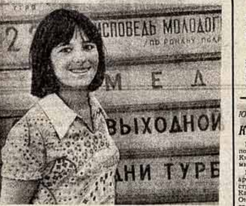
Имя Наталья Варлей уже хорошо известно зрителю. Еще будучи студенткой Театрального училища имени В. Шушнина, она успешно сыграла в фильме «Наказанная пленница». И вот годы учебы позади. Молодая актриса принята в труппу Московского драматического театра имени К. С. Станиславского. Ей предстоят новые роли, интересные творческие поиски.

Днепропетровский украинский музыкально-драматический театр имени Т. Г. Шевченко приехал в республику Северного Кавказа. Шевченковцы побывали в Чечено-Ингушетии и Северной Осетии, встречались с рабочими, шахтерами, колхозниками. За большую культурно-воспитательную работу среди трудящихся республики театр награжден почетной грамотой Президиума Верховного Совета Чечено-Ингушетийской АССР. В Ступино выступил один из старейших театров Закарпатья — Государственный армянский драматический театр имени Шаумяна. По сообщениям наших читателей в корреспонденции.