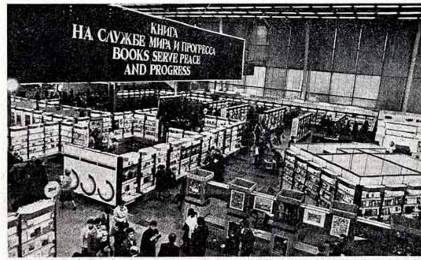
В одной из павильонов выставки.