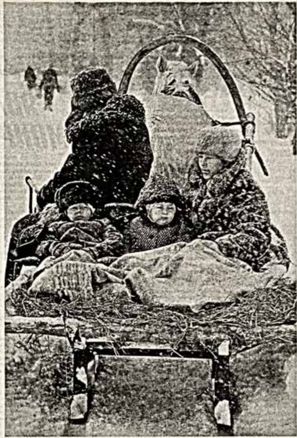
В гости к деду всей семье.