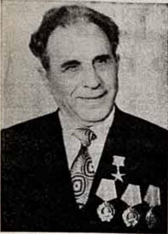
Трудяки орденосный завод «Ростсельмаш» — первенец советских пятилеток, гигант отечественного комбайностроения...