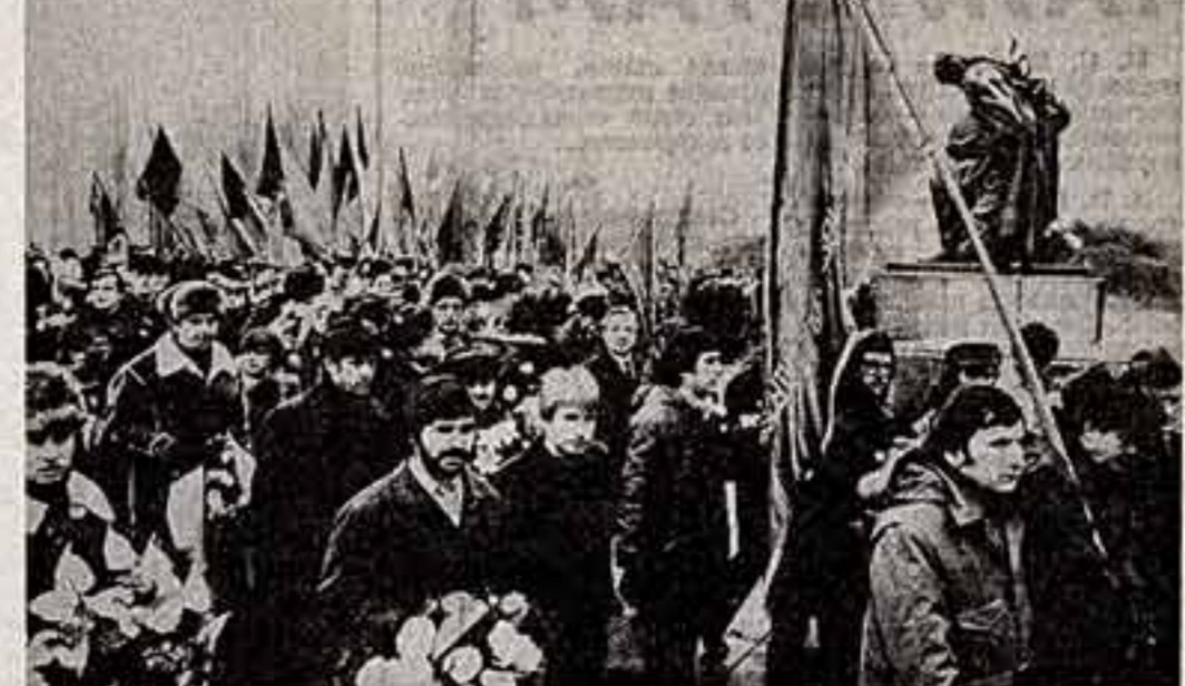
Тысячи берлинцев и жителей других городов ГДР приходят к памятнику в Трептов-парке.

Г. ГЕРАСИМОВА, корр. ТАСС — специально для «Советской культуры».