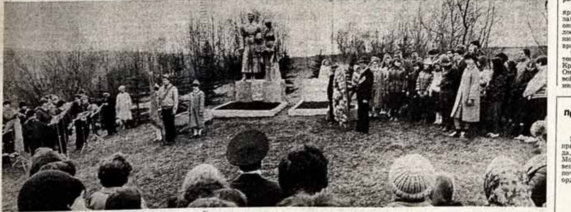
Зимой 1941 года в окрестностях города Ржева, между деревнями Городиловое и Горбово, проходила линия фронта. Во время наступления наших войск только на этом крошечном участке участвовало более четырехсот советских воинов. Жители деревни Городиловое захоронили лавины на высокой бровке Ржева. В их честь установили памятники, над которыми шагает коллектив учащихся и преподавателей Центральной средней специальной мужской школы при Московском консерватории.

Командиры, политорганы, партийные и комсомольские организации делают все для повышения боевой готовности Советской Армии и Военно-Морского Флота, умело используют отношения взаимопомощи и взаимопомощи между воинами для совершенствования их боевого мастерства, формирования высоких морально-политических качеств, укрепления воинской дисциплины. Заключившийся зимний период обучения еще раз убедительно показал, что советские воины достойно продолжают сегодня славу героев Великой Отечественной войны.