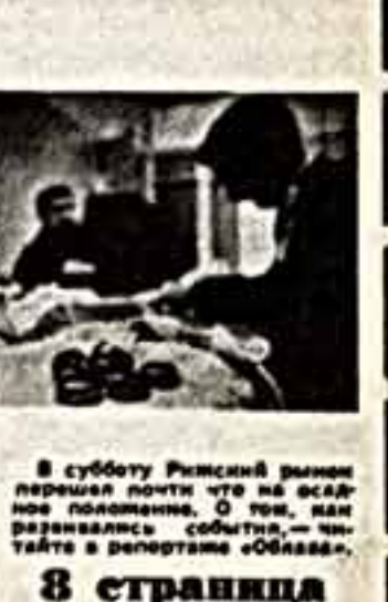
В субботу Рижский рынок перешел почти что на всенародное положение. О том, как развивались события, читайте в репортаже «Облава».