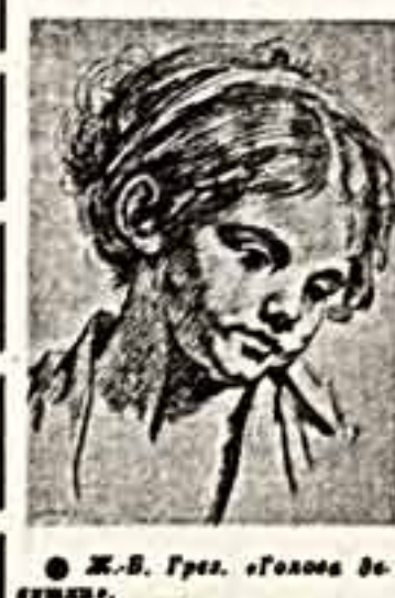
Ж. В. Грег. «Голова в штани».