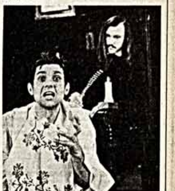
Полтавца — А. Рыженко, Гоголь — В. Козель.

Волгоград. Повесть Ю. Мишатикина «Невольники чести», рассказывающая о последних годах жизни