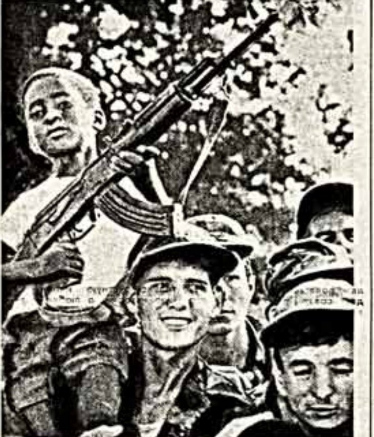
Людмила, Жители англоязычного столицы провозжат кубинских воинов-интернационалистов.

«Дело Челентано», казавшееся многим энсервизмом, тем не менее продолжается. И еще неизвестно, какой оно примет оборот. (ТАСС)