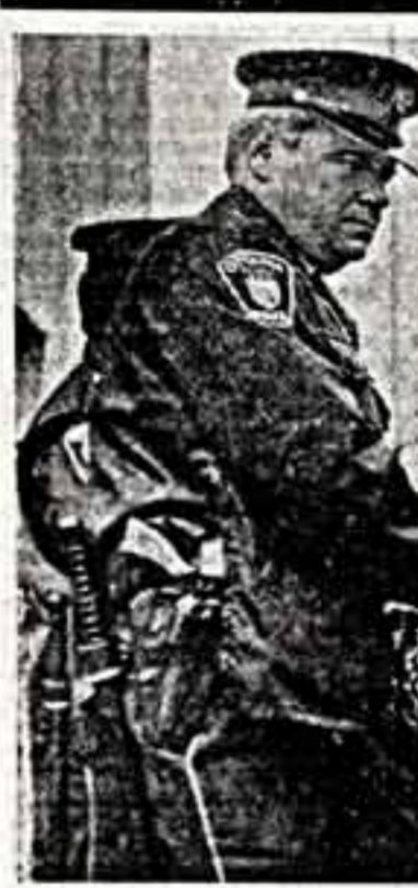
Так полица Канады расправаляется с участниками антивоенных манифестаций.

Зимняя Прага сказочно хороша, когда приближаются лучи солнца высвечивают ее величие. В ней история и современность, будущее и день сегодняшней, сотканые из судеб людей — простых, трагичных и великих.