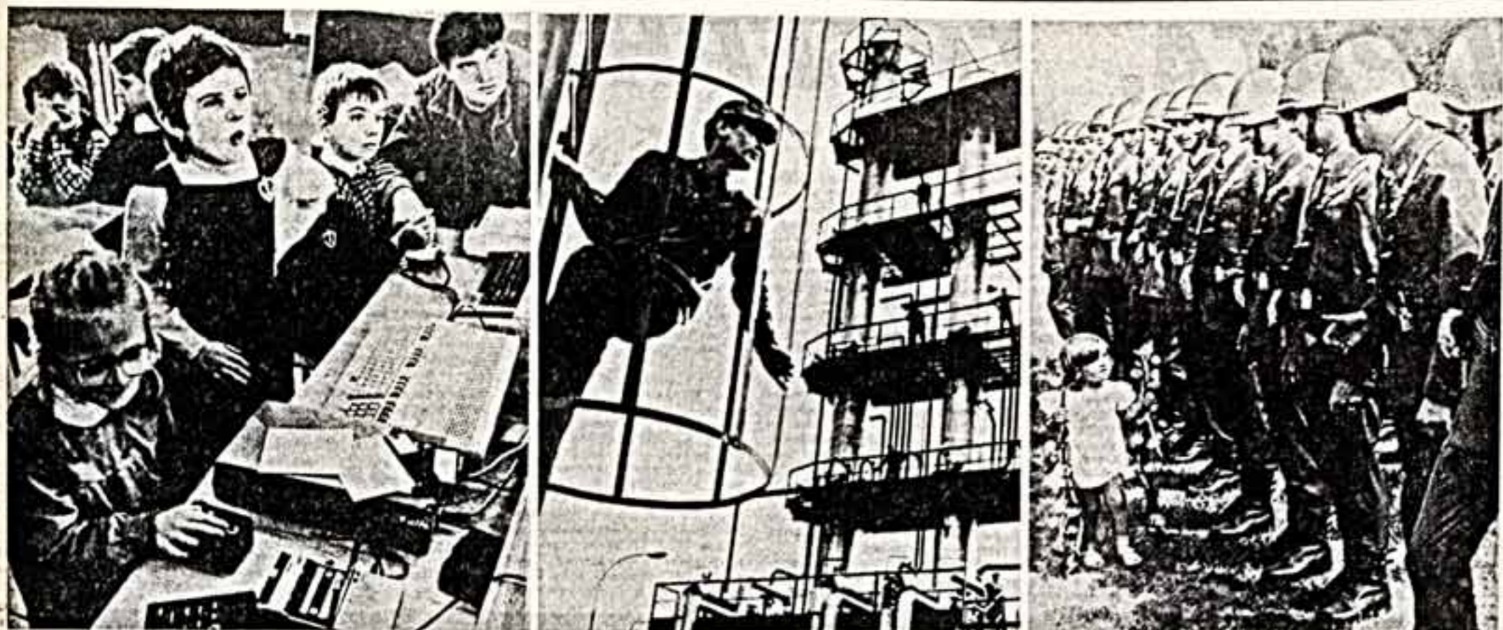
В Москве в Центральном выставочном зале Союза журналистов СССР на Гоголевском бульваре работает выставка «Мастера польской фотографии». Это одна из крупнейших зарубежных выставок польской фотографии.