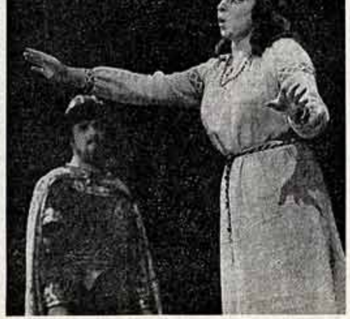
Иван Петров, народный артист СССР, лауреат Государственных премий СССР. Сцена из первой акта. Феонтия — заслуженная артистка РСФСР Р. Калинин.