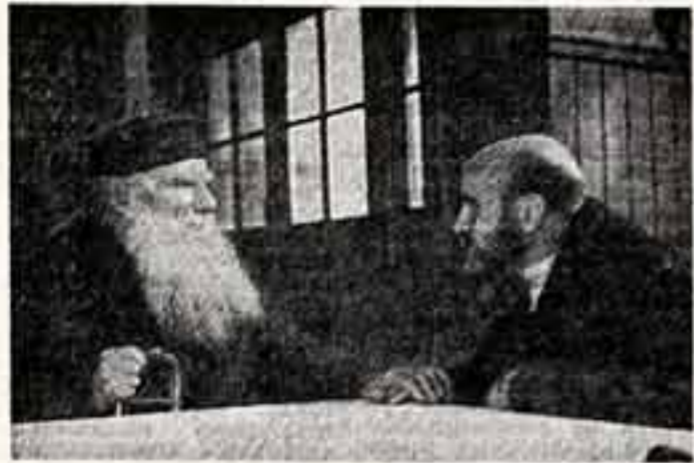
В фильме «Лев Толстой», который во своем сценарии разработал киностудия имени М. Горького...