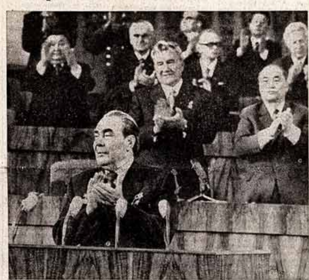
● На трибуне — Генеральный секретарь ЦК КПСС товарищ Л. И. Брежнев.

Товарищи! Вы хорошо знаете, с какими сложностями приходится столкнуться нашему сельскому хозяйству в связи с неблагоприятными погодными условиями в девятый пятилетие и особенно в прошлом году. Но мы смогли обеспечить нормальный ритм развития страны и нормальные условия жизни народа. (Аплодисменты). За это надо отдать должное колхозному крестьянству и рабочему классу, всей нашей партии. (Продолжительные аплодисменты).