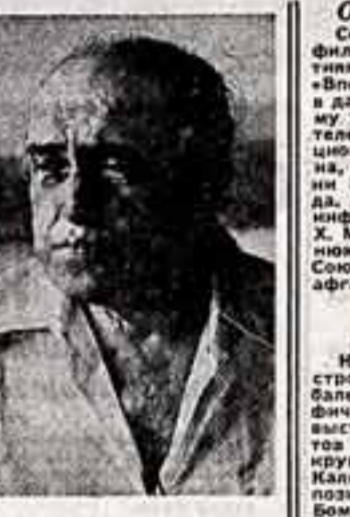
Нимейер-художник и начинается Нимейер-политик! Как ни парадоксально это звучит, архитектору всегда оставалось у меня во втором плане. Правда, я отдаю ей слишком много времени и сил, и в итоге ни хватает для более важных дел.