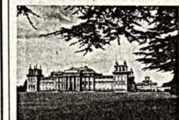
В РОДОВОМ ГНЕЗДЕ ЧЕРЧИЛЛЯ

Величественное здание Бленгеймского дворца порифидно творческой фантазии архитектора сэра Джона Ванбру. Этой работе он посвятил около 20 лет, и сегодня дворец считается одним из лучших образцов «барокко» в архитектуре.