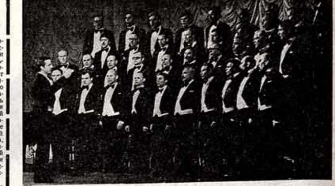
Образцовый мужской хор «Саналас» МВД Литовской ССР — лауреат всеююзных и республиканских конкурсов самодельного художественного творчества.

В активе молодых таджикских художников немало ценных качеств. Взять хотя бы их желание всякий раз раскрывать в работе полностью и увлеченно. Нельзя не поддержать и настойчивое стремление молодых выразить умноженное сверстников, формулировать современное понимание национальной истории, своеобразия таджикского быта, природы, всей жизни народа.