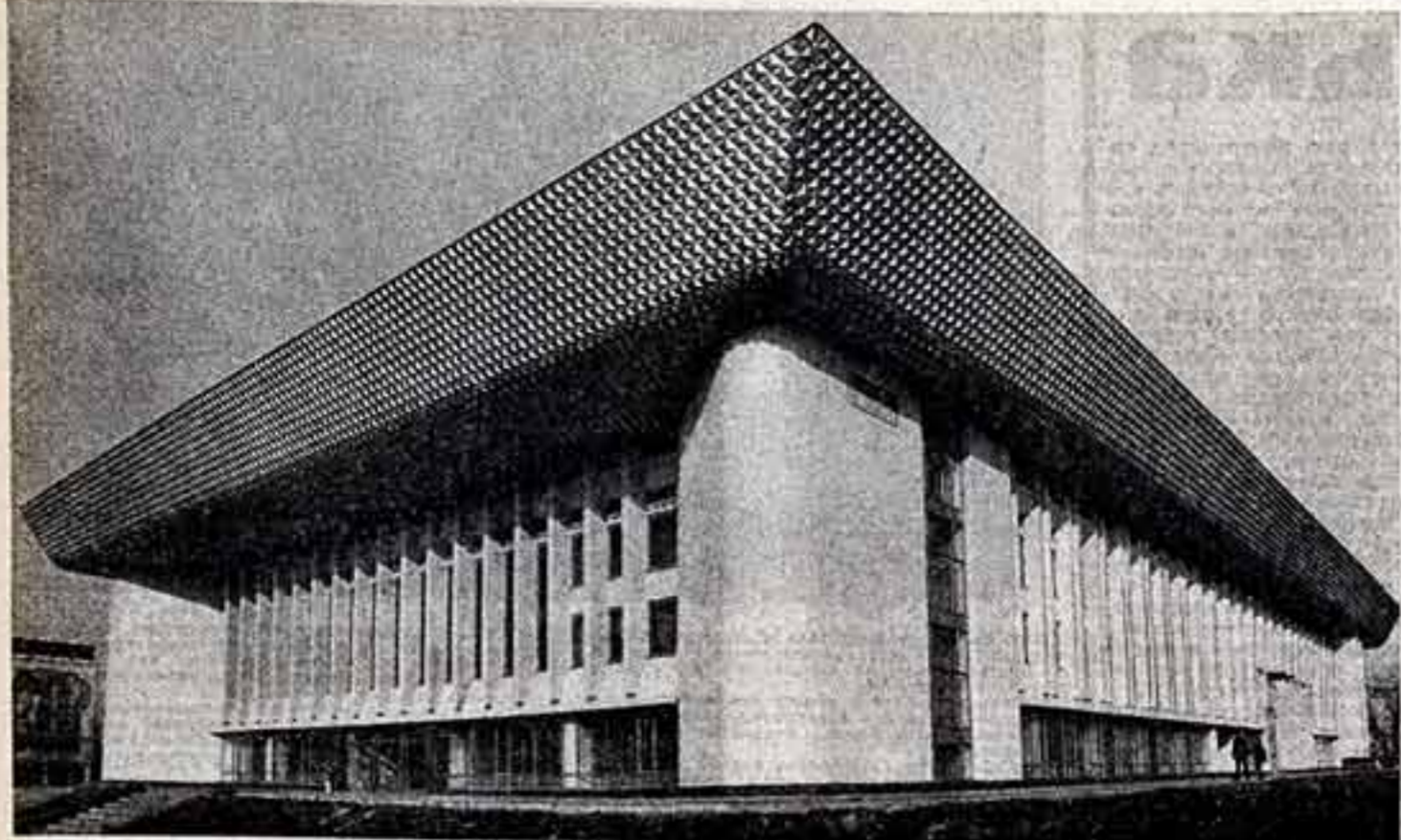
Большой подарок к 60-летию образования СССР...