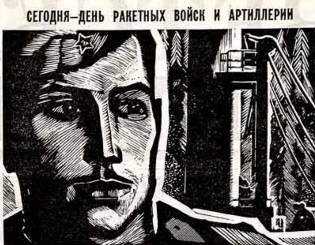
Советский народ и Вооруженные Силы Страны Советов празднуют сегодня День ракетных войск и артиллерии. Родина высоко ценит ратный труд и подвиги воинов-ракетчиков и артиллеристов, приумножающих слабые боевые традиции Советской Армии, заслуги рабочих, инженерно-технических и научных работников оборонной промышленности.