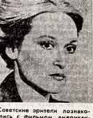
Советские зрители познакомились с фильмом американского кинорежиссера Роберта Бентона «Крайер против Крайера»...