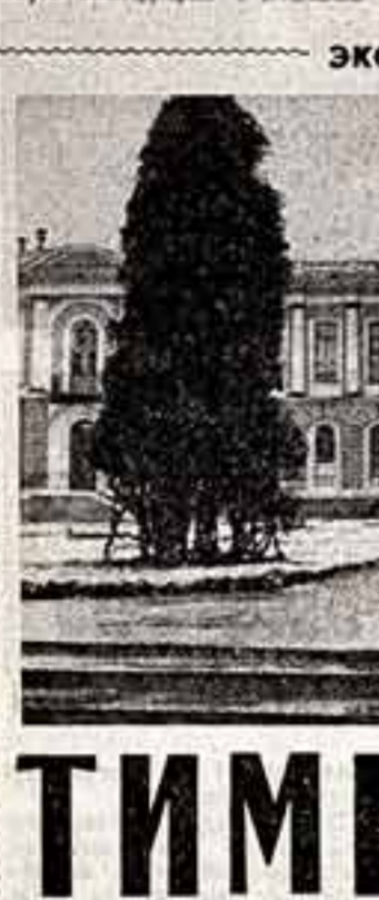
экскурсия для читателей

Факты ее истории: в 1868 году купили у окрестных крестьян в дуплах и лесах и начали научные наблюдения. Потом приобрели рабочие усадьбы. В 30-х годах здесь был заложены смелый эксперимент — акклиматизация лиственничной хвои в северных широтах страны. Посадили лиственничные хозяйства комбината «Воркутауголь» в Коми АССР, в Якутию. Ставились двойные цели — испытание возможности лиственничных Севера в поминание урожая овощей опылением цветка. Результаты радовали. В 1934 году перенесли 23 пчелиные семьи на Колюшкин полуостров в совхоз «Иркутск». Урожай огурцов в теплицах по сравнению с рутинным обильнее в совхозе возрос в несколько раз. Был выведен и выведен мед. В 1940 году пасека отправилась в Западную новую экспедицию с пчелами.