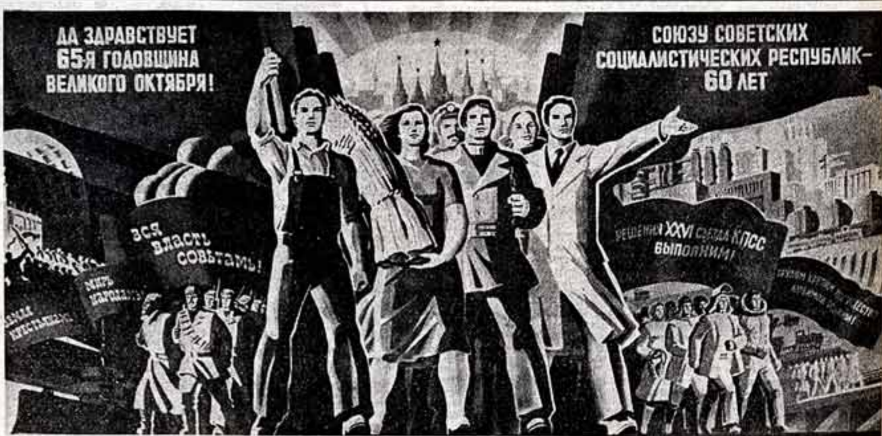
Плакат работы художника Э. Сажокова. (Издательство «Плакат».)

Советские люди под испытанным руководством Коммунистической партии и ее ленинского Центрального Комитета решают всемирно-исторические задачи коммунистического строительства. Обществу свободы и социальной справедливости, братства людей труда, каким является наше советское общество, уверенно идет вперед к достижению великой цели, поставленной перед ним партией. «Коммунистическая партия Советского Союза», — сказал на траурном митинге на Красной площади Ю. В. Андропов, — твердо заявляет, что служение делу рабочего класса, трудового народа, делу коммунизма и мира, которому посвятил всю свою жизнь Леонид Ильич Брежнев, составляет и будет составлять высшую цель и смысл всей ее деятельности».