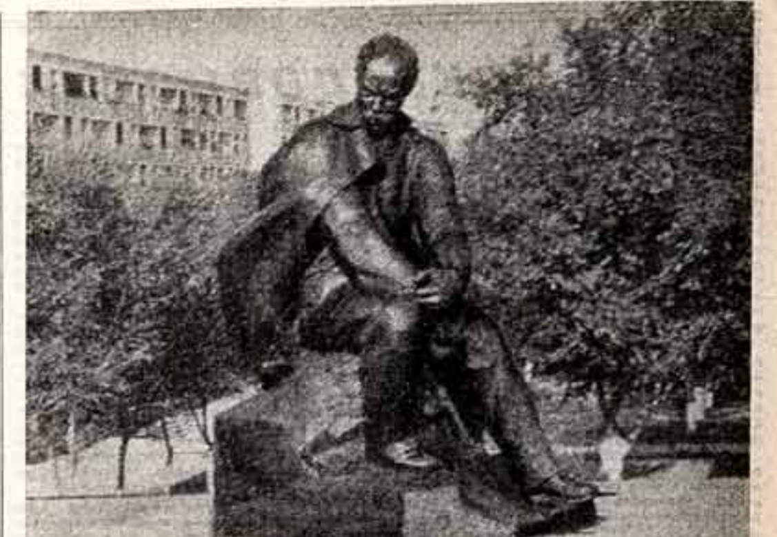
На бульваре 50-летия Советской власти города Шевченко в Казахской ССР установлен памятник отложившемуся в сталинский период В. Суриков и Ленинградский архитектор Е. Федоров. В основание памятника заложены капсулы с землей города Канска, с могилы Кобяряя.