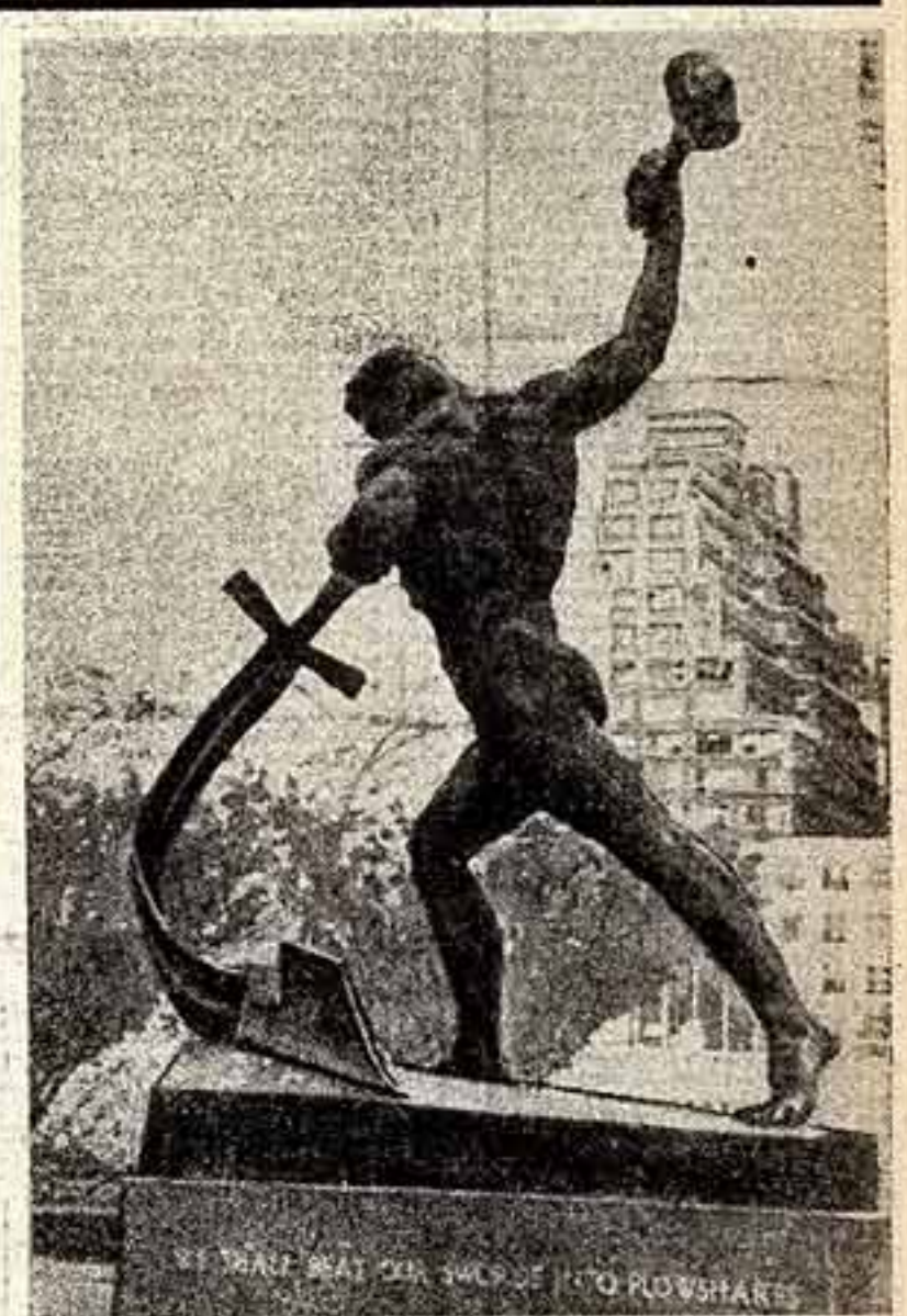
Скульптура Е. Бучачича «Перекуем мечи на орала» в Нью-Йорке.

В получении этих материалов, помимо наших корреспондентов, большую помощь редакции оказали зарубежные корреспонденты ТАСС и АПН.