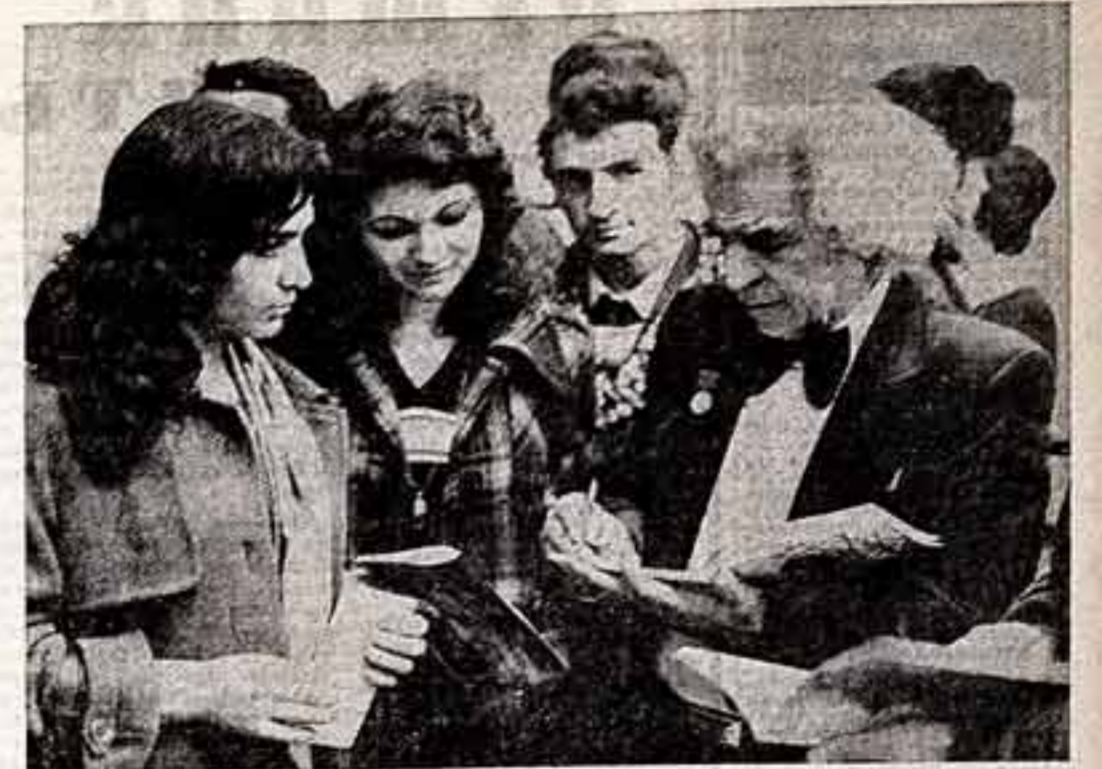
В Доме художника Арменки в Ереване открыта выставка произведений лауреата Государственной премии СССР, народного художника Армении Николая Миногосяна. Более двухсот традиций скульптур, живописных и графических работ представил автор на суд общественности. На вернисаже в Доме художника Арменки Н. Никогосян дает автограф посетителям выставки.