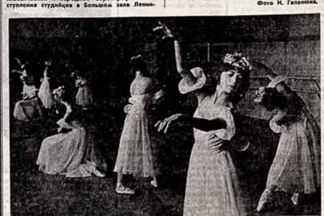
Большой популярностью пользуется студия классической и народной хореографии. Выступают студийцы в Большом зале Ленина...