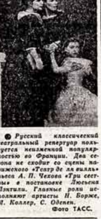
Русский классический театральный репертуар пользуется неизменной популярностью во Франции. Деятели искусства восторженно принимают участие в фестивале «Театр де ла выалле»...