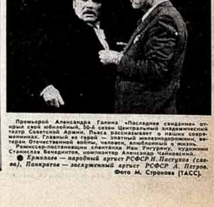
Премьерой Александра Галина «Последнее свидание» открыл свой обильный 30-й сезон Центральный академический театр Советской Армии. Пьеса рассказывает о мужестве и любви в годы войны...