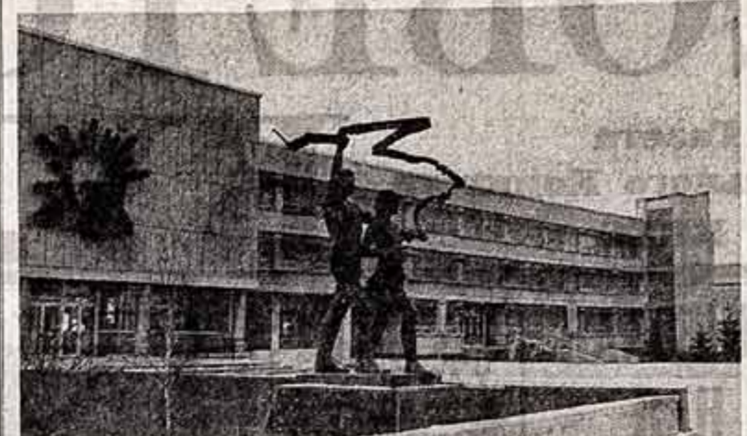
Около сотни кружков и студий работают во Дворце пионеров города Ульяновска, объединяя более трех тысяч ребят школьного возраста...