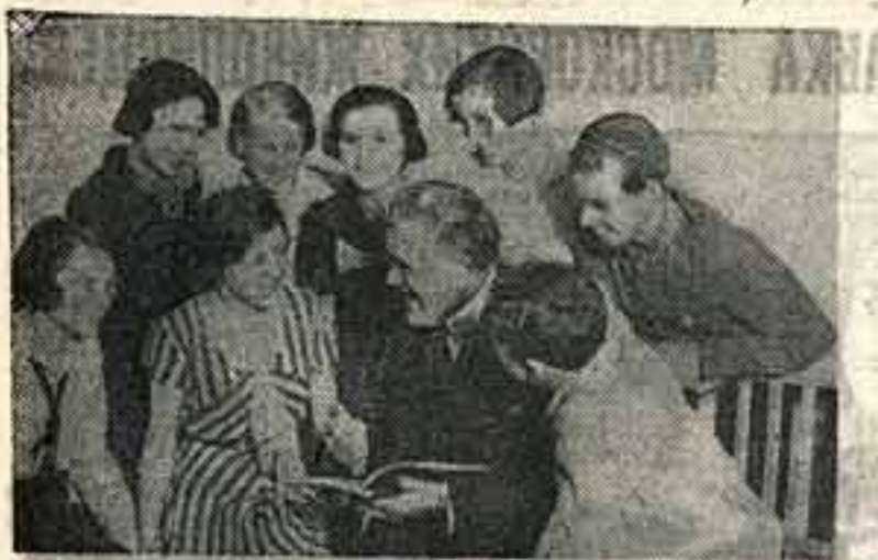
И. М. МОСКВИН У ЮНЫХ АКТЕРОВ