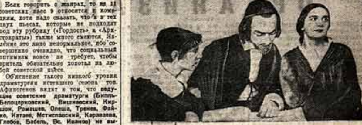
Воронежский Большой советский театр. «Уроки Антона». Постановка В. М. Зингера-Кривого, оформление Н. Л. Степанова.