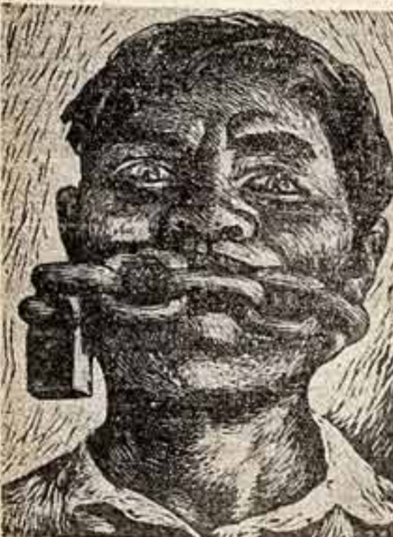
«Свобода слова» — так иронически назвал свою замечательную работу мексиканский график Адольфо Мехикан. Гордая и гневная эта ирония: она будет ненависть и порабощением народа, зовет и борьбу. «СВОБОДА СЛОВА», АДЛЬОФО МЕХИКАН (МЕКСИКА).

дет развернута экспозиция произведений молодых художников Италии, Исландии и Канады. Искусство сближает народы. Так пусть же творческие встречи молодых художников — очные и заочные — послужат самому большому и благородному делу на свете: делу защиты мира.