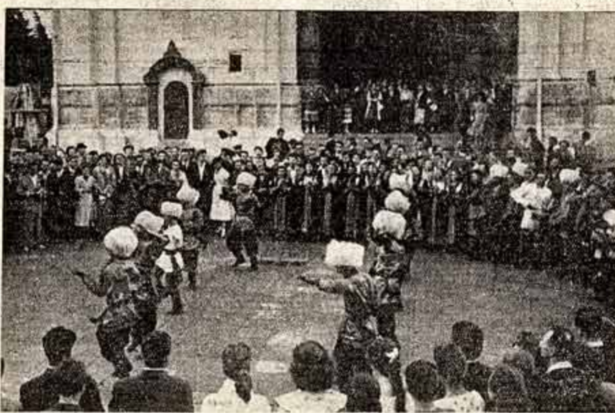
Кремль. Танцы на Соборной площади.

В «Форуме» показывались египетский фильм «Слава», французский — «Собор Парижской богоматери», советский — «Товарищ ухаживает в море» и болгарский — «Это случилось на улице».