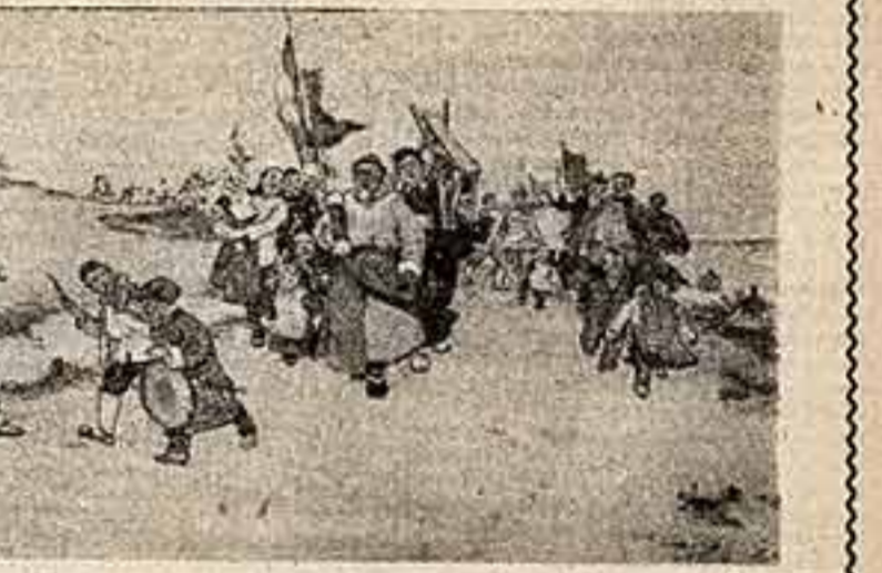
В традициях народного лубка написана работа китайского художника Лю Вэнь-си «День создания кооператива». Яркие солнечные краски, заданная присущие этому жанру, как нельзя лучше отвечают радостному настроению людей, вступающих в новую жизнь. Композиция мажорна и светла по ша — душа линующая и оживленная. «ДЕНЬ СОЗДАНИЯ КООПЕРАТИВА», ЛЮ ВЭНЬ-СИ (КИТАЙ).