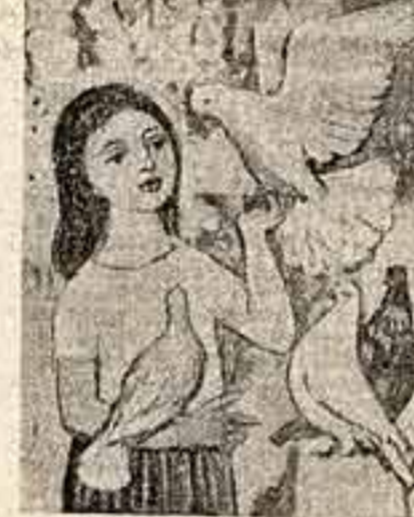
Газетная репродукция не позволяет, и конечно, передать своеобразное живописное решение этого произведения. А это прекрасная «ДЕВУШКА С ГОЛУБИМИ», ВАЛТЕР БОМАЦА (Германская Демократическая республика).

Выставка эта убеждает, что именно реалистические работы наиболее горячо и всеобъемлюще агитируют за мир и дружбу. Т. З. ТАН (Вьетнам), студент-геолог.