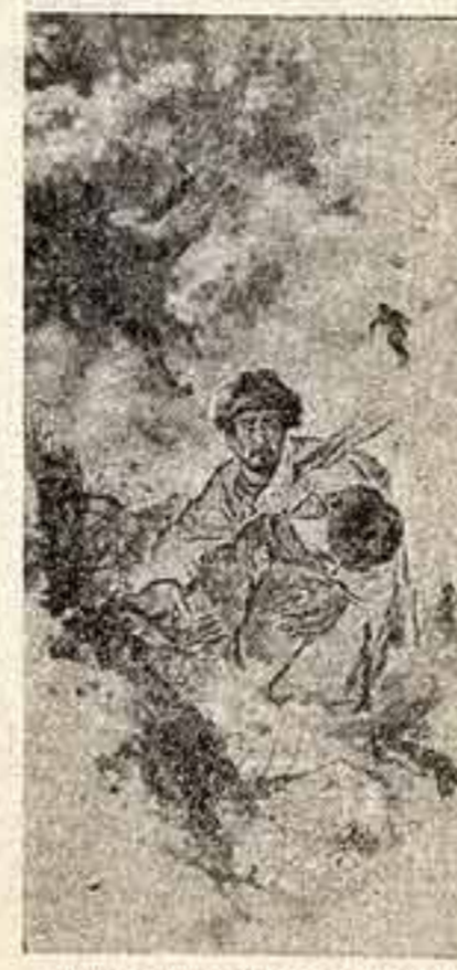
Память народа всегда благодарна: люди не забывают о благородстве и верности друзей, пришедших им на помощь в трудные времена испытаний. Рисунка изобразил морейский крестьянин слезает броне — китайского добровольца — их сражения единая борьба за свободу и счастье народа. «КРЕСТЬЯНИН ПАК ЧЭ ГЫН ОКАЗЫВАЕТ ПОМОЩЬ КИТАЙСКОМУ ДОБРОВОЛЬЦУ», ЛИ ЖЬ СОН (КОРЕЯ).