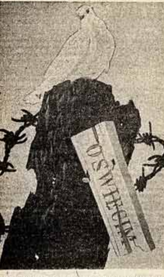
Белоснежная голубка, испорченная сегодня на развалинах уничтоженного «лагеря смерти» Освенцима, — это светлый символ непреломленной веры людей в торжество дела мира, их надежды на то, что прошлое не должно повториться! «ОСВЕНЦИМ», К. КАРАПАНОВ (БОЛГАРИЯ).