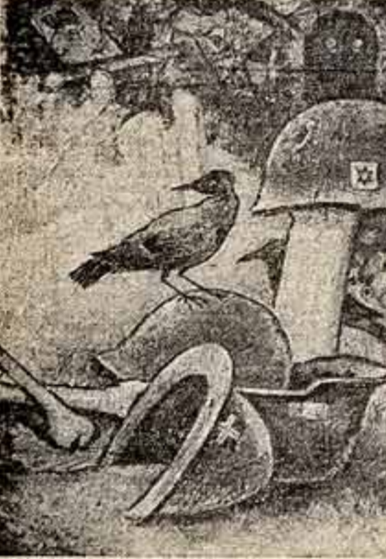
Есть произведения искусства, под которыми на чужбине посетитель подлинно чувствует себя художественный замысел выражен предельно ясно. «ЕГИПЕТ — МОГИЛА ИНТЕРВЕНТОВ», САМИ РАФЕК (ЕГИПЕТ).