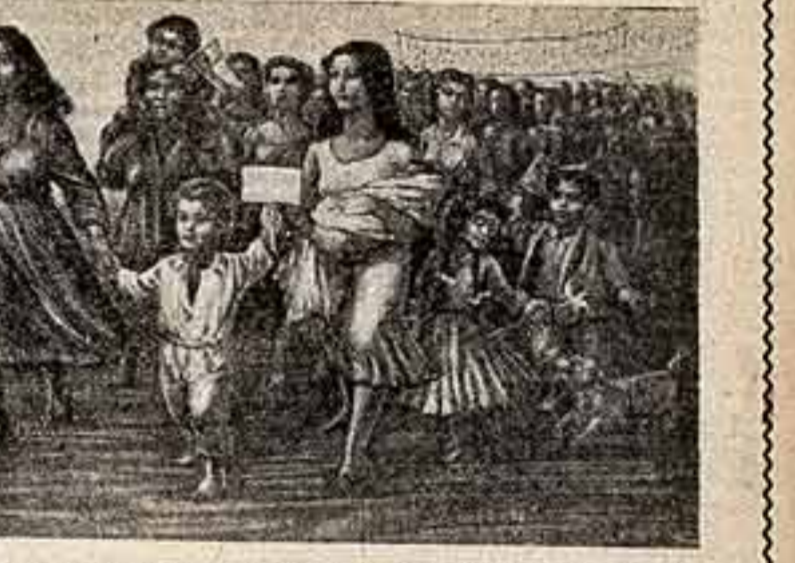
Матери всех стран и материков земли поднимают свой гневный и решительный голос протеста против угрозы новой войны. Всей силой и нежностью материнской любви хотят, чтобы их дети были счастливы, а счастье и мир неразрывны, как неразрывны любовь и нежность в сердце матери... «ДЕМОНСТРАЦИЯ», ПЕДРО ЛОБОС (ЧИЛИ).