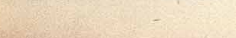
«Ночится ли это хорошо?» — эстрадное представление кукольного театра «Радость».

«Радость» — так и назвала встречами своей первой кукольный театр, созданный при помощи чехословацких кукольников. Вот мы знакомимся с репертуаром чехословацкой «Радости», организованной коллективом самодеятельности преподавателей и студентов педагогического института в Брно. Рядом с пьесами Кайнара, Калаба, Симанова, Машка — хорошо знакомые названия ершовского «Конька-Горбунка», «Аленького цветочка» Карауловой и Браусевича, «Веселые мелочи» Поляновой. «Отважный Динь» Зельмер и Димит, «Буратино» Борисовой. Впрочем, вероятно, и коллектив «Радости» не менее радуется, что многие пьесы национального репертуара также знакомы советскому зрителю. Пленительные образы сказки И. Кайнара «Златолавля» ожила на сценах кукольных театров Грозного, Уфы, Мурманска, Ленинграда, Пензы, Забайкалья «Мичек-Фавчик» Я. Малюка начал новый тур своих странствий со сцены ленинградского театра под руководством Деменина.