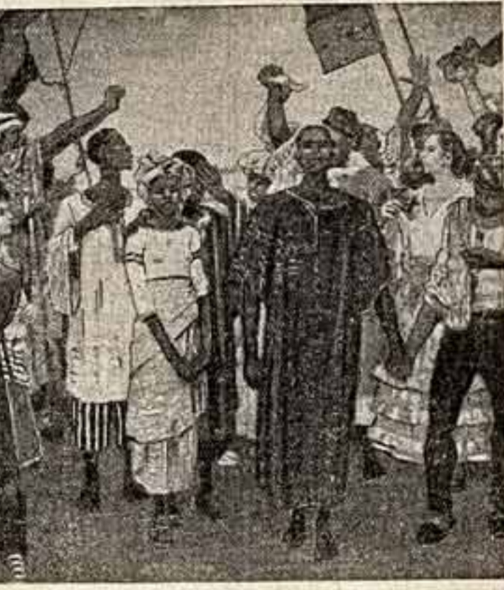
Дети разных народов, мы мечтаю о мире живем. ВСЕСОЮЗНАЯ ЮБИЛЕЙНАЯ ХУДОЖЕСТВЕННАЯ ВЫСТАВКА. А. Мылников. «Пробуждение».

против гнусностей общества, основанного на присвоении привилегированным меньшинством плодов труда большинства, систематически самозабывались, маскерализовались, а вычленились, наоборот, более слабые стороны произведений французского философа, также как ослепленность и против атрибуты систематичности. Октябрьская революция грянула, как пушечный выстрел, в дремлющую тишину великосветских салонов. И с начала Октябрьской революции становилось невозможным далее игнорировать представителей новой культуры, а старая культура должна была подвергнуться перестрою, переосмыслению. С этого времени новая революционная культура стала распространяться во всеорасходящей быстротой, а носители прежней культуры, все еще укрывавшиеся в своей старой крепости, принялись за изучение марксистской философии. Они хотят знать секреты противника. Развитие марксистской мысли, особенно марксистский подход к решению экономических проблем, оказало влияние на противников марксизма. В Западной Европе (меньше в Америке) стали задумываться, а не является ли марксистский анализ в корне правильным? Так, например, противники марксизма обвиняют коммунистов в разжигании классовых борб, но они не отрицают уже, как прежде, наличие борб классов; они часто, не колеблясь, пользуются марксистской терминологией, даже при нападки на марксизм. Факты говорят о том, что после Ок-