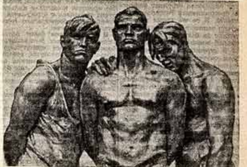
«Верую великому сердцу человечего!» — МАЙКОВСКИЙ, И. Ф. Фрейский. «Сильнее смерти». Фрагмент.

В. СОЛОВЬЕВ-СЕДОВ, народный артист СССР.