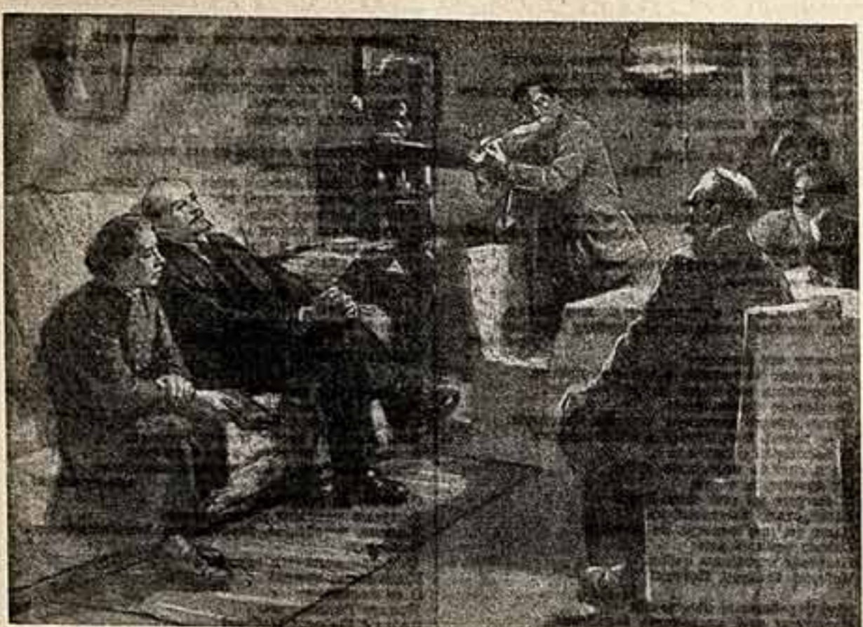
Много картин, экспонированных на Всесоюзной художественной выставке, посвященной 40-летию Октябрьской революции. На сцене выставлены произведения современных художников, в том числе А. М. Горький в своих воспоминаниях приводит такое высказывание Владимира Ильича:

В. СОЛОВЬЕВ-СЕДОВ, народный артист СССР.