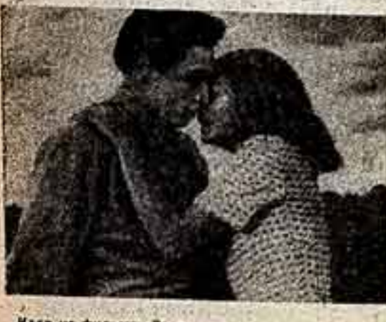
Кадр из фильма «Зосья».

ЭТО РАДОСТЬ — нет, не будем бояться выскоки слова — это счастье, когда в искусстве, которому сам ты отдаешь много лет и все силы, в искусство, которое рождено и развивается на твоих глазах, приходит молодой талантливый художник. Это значит — искусство живет. Это значит — завтра оно будет еще сильнее, богаче и прекраснее, чем сегодня.