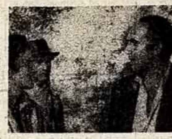
Кадр из фильма «Один человек в Большом».