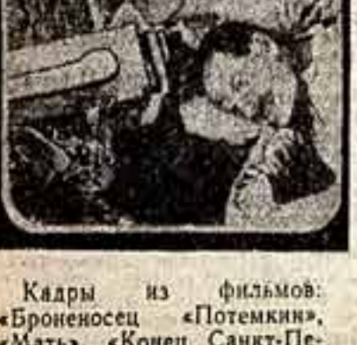
Кадры из фильмов: «Броненосец «Потемкин», «Мать», «Конек-Санкт-Петербург», «Земля», «Встречный», «Мы из Кронштадта», «Депутат Балтики», «Последняя ночь», «Чапаев».

ВЕЛИКИЙ И СЛАВНЫЙ ПУТЬ прошла наша страна за 50 лет Советской власти. Путь блестящих побед и грандиозных свершений; путь суровых и грозных испытаний, путь труда и борьбы. И всегда, на всем этом пути советское киноискусство было вместе с народом, вместе с партией. От первых, коротких документальных фильмов, снятых на случайно добытых камерах между собой кусочек пленки, снятых с помощью простейшей аппаратуры и обработанных в примитивных, кустарных условиях, до монументальных полотен — цветных, широкоформатных, со стереоскопической звуковой дорожкой — все это служило и служит одной цели: воспеваю праздки нового мира.