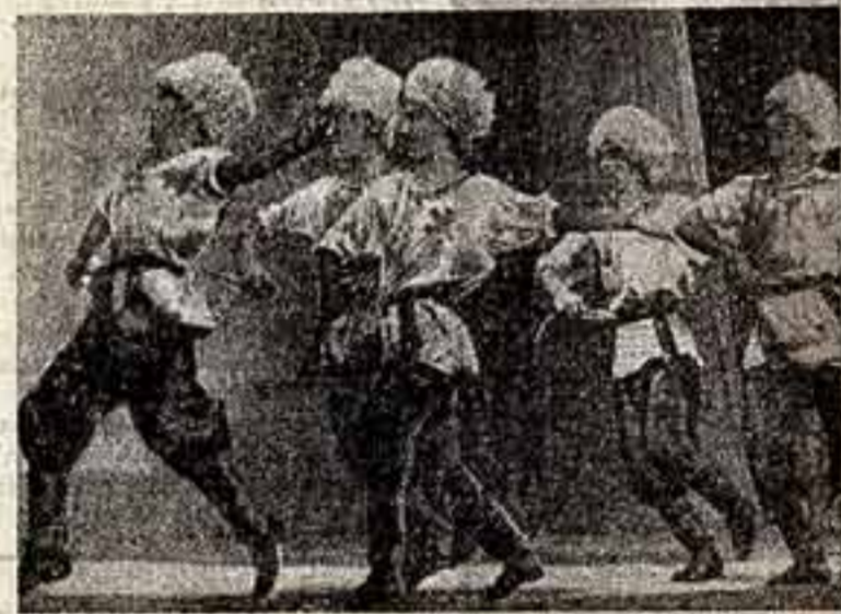
Танец «Дигити» исполняет мусская группа Ансамбля народного танца ТССР.