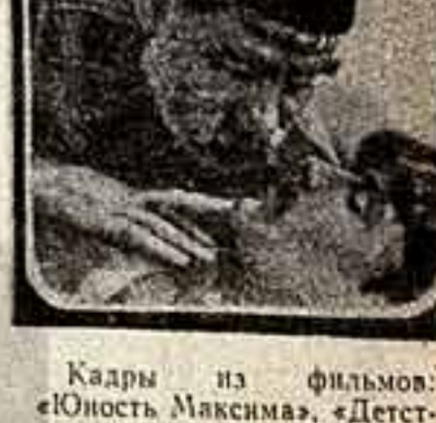
Кадры из фильмов: «Юность Максима», «Детство», «Ленин в Октябре», «Волга-Волга», «Летят журавли», «Баллада о солдате», «Ленин в Польше», «Коммунист», «Отец солдата».