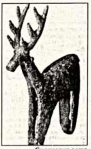
Статуэтка оленя VII в до н. э.