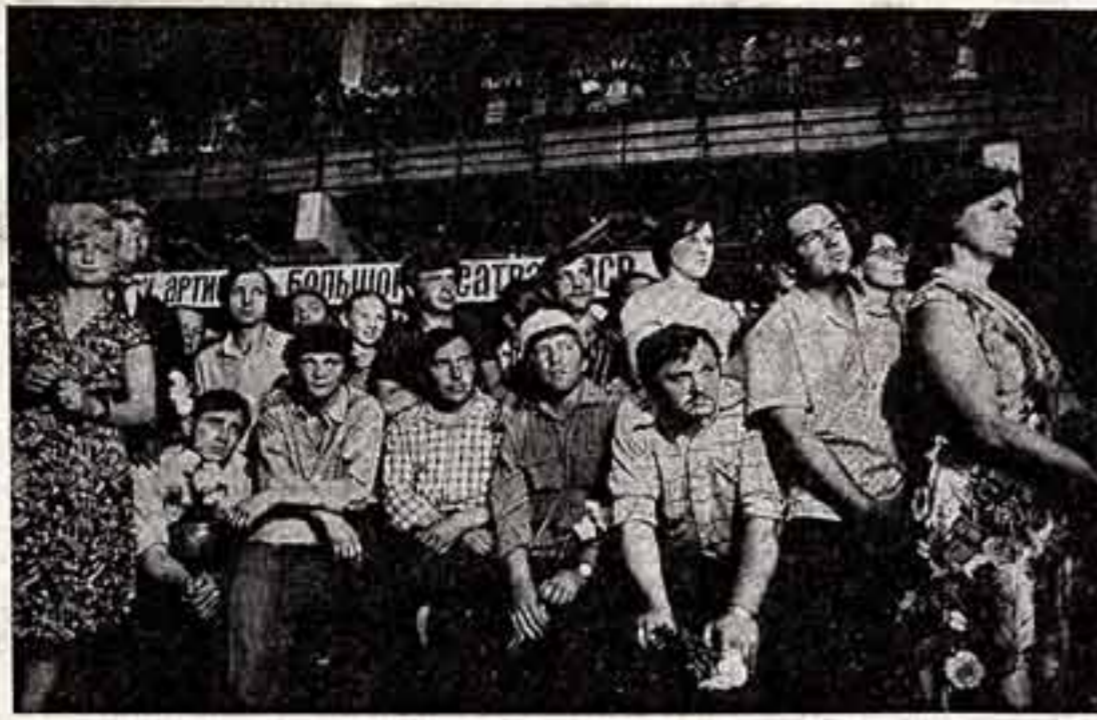
Экипаж корабля «Ленинград» в порту Кампонгсаома.