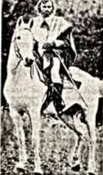
Франко Неро в роли Гарибальди.

«Генерал» — так называется новый четырехсерийный телевизионный фильм, показанный в Италии. Эта лента, которую снял итальянский режиссер Луиджи Маньи, прелекала и экранам телевизионного огромного зрительского аудиторiums. Роль Гарибальди играет известный итальянский актер Франко Неро. Режиссер дал ему ответственное задание: сойти со своего пьедестала, позвать его привязанность, сомнения, рассказать, как он жил, как вел себя не только на поле битвы, но и среди друзей и противников. «История всегда меня привлекала», — рассказывает Луиджи Маньи. «А XVIII век, в котором развертывается действие фильма, — век самый интересный в истории. Меня очень интересуют это время, очень нравятся непонятные зрителю о проблемах, которые не решены и до сих пор, заставить задуматься над ними.