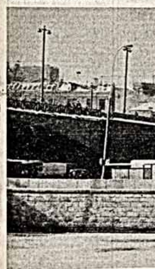
Бессмертно творение Баженова...

«...От роду ему 35 лет». В такие-то годы Баженов — академик трех академий: парижской диплом подвизал крупнейшим архитектором Франции, ему доверят грандиозная даже по нынешним временам стройка в Кремле, он уже создал свою школу, свою «архитекторскую команду», в которой — другой гений, его ровесник. А нынешний архитектор в тридцать пять? Кто ему доверяет? Как он может прожить себя? Сидит себе на десятках ролях в каком-нибудь проектом институте, где господствует над умами нечто отнюдь не дерзкое, а благонамеренно среднее, типовое. Разве знаменитый поэт, слажем, Андрей Вознесенский, по профессии архитектор, посылает ему свой стих, как послышал их Давидович Баженову, когда тот приступил к кремлевской стройке: «Баженов, начинай! Уступит естество...?»