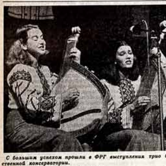
С большим успехом прошли в ФРГ выступления трио бандуристок Львовской государственной консерватории.