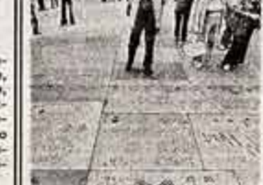
В Голливуде, столице американского кино, существует традиция: на цементных плитах тротуара одной из его площадей размещены выжженные отпечатки рук, ног или автографов.