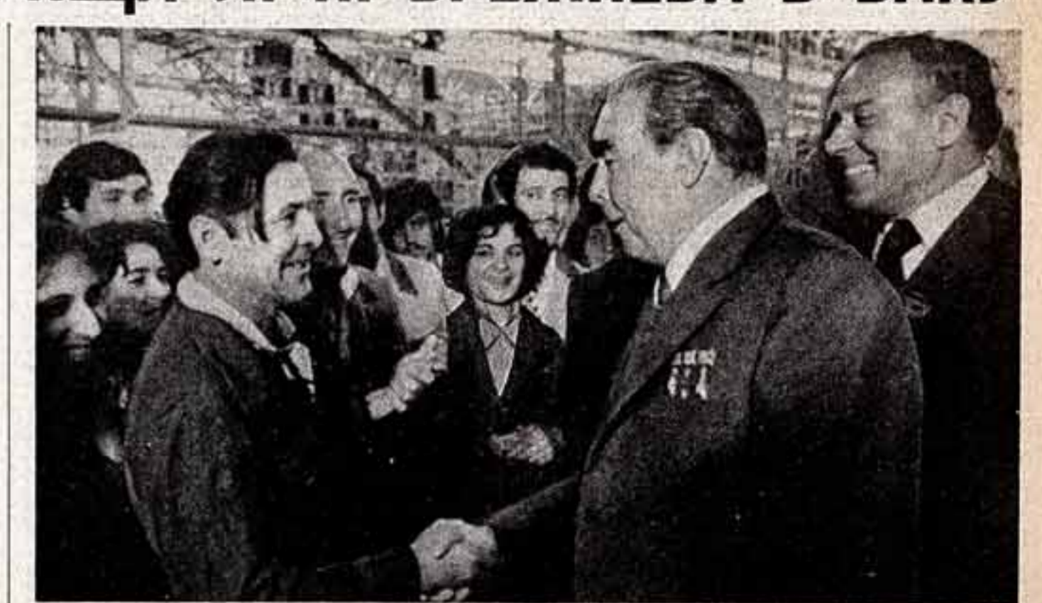
Л. И. БРЕЖНЕВ на заводе бытовых кондиционеров.