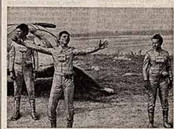
Кадр из фильма «Открытие во восточной».