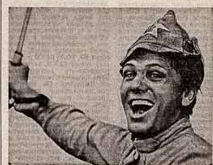
Кадр из фильма «Долгое дно».