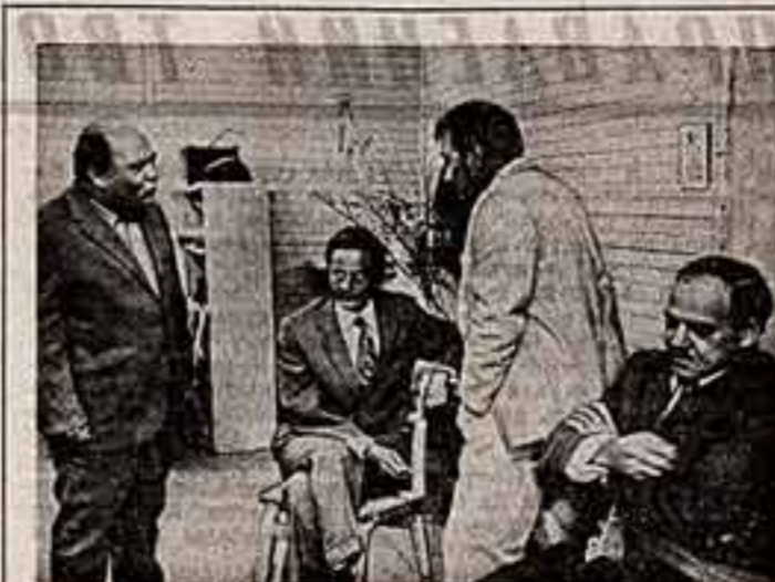
Кадр из фильма «Премия».