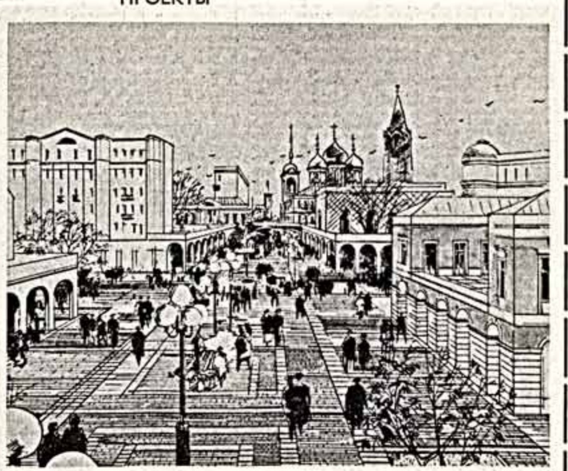
районы массовой застройки, а в старые рестораны, рестораны и кафе в центре, чтобы максимально сохранить аромат старой Якиманки. И. КАРТАШОВА.

— Что же стали редко ездить композиторы и музыканты в нашу область? — Вот-вот! Хороший вопрос! — слово обрадовался Никончик Евгений.