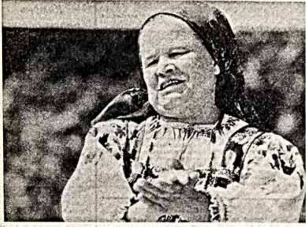
Алексей Лебедев — талантливый фотограф, участник многих выставок...