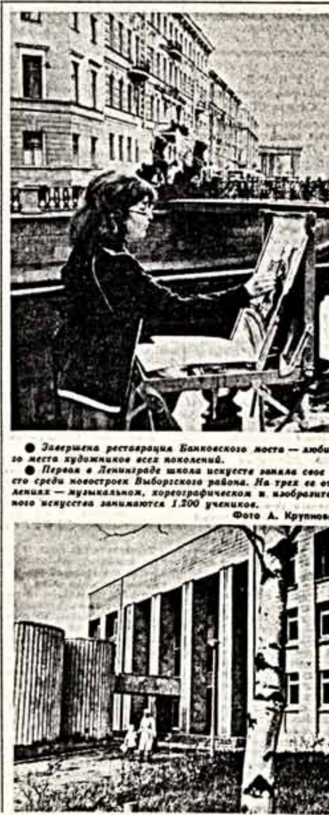
Подборку подготовили корреспонденты «СК» и ТАСС.