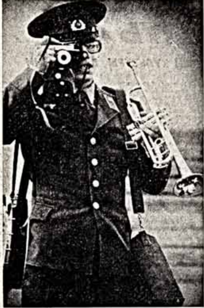
Почему бы вам не написать о том, как мало у нас современных музыкальных программ...