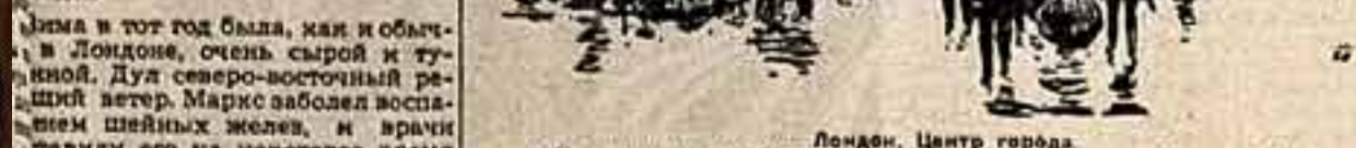
Лондон. Центр города. На рисунке Н. Жукова и в книге «Воспоминания о Марксе и Энгельсе».

«Процитированная фраза из Флеровского — первая русская фраза, которую я вполне понимаю без словаря».