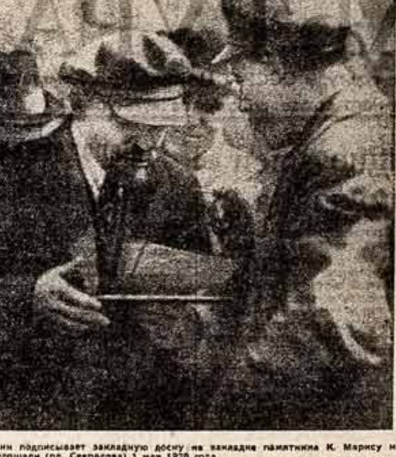
В. И. Ленин подписывает закладную доску на здании памятника К. Марксу на Театральной площади (пл. Свердлова) 1 мая 1920 года.