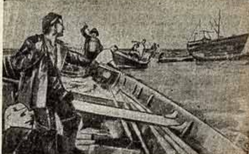
Я. Осен. «Латышские рыбаки». (Из альбомов «Изобразительное искусство Латвийской ССР»).

Эти замечательные альбомы переизданы в серый холст, украшенный национальными орнаментами. Здесь представлены лучшие произведения советского изобразительного искусства братьев союзных республик.