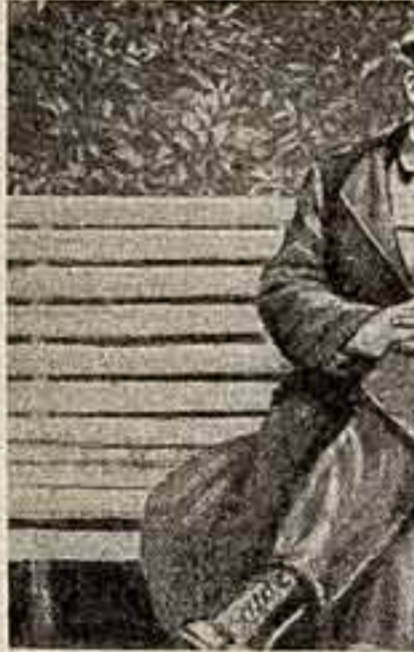
Кадр из фильма «Здесь жил Ленин». В. И. Ленин в Горках.

Отсюда, из Москвы, по всей стране, как лебедь, звучало могучее ленинское слово, поднимавшее народ на защиту Октябрьских завоеваний, на строительство социализма, призывавшее на борьбу за свободу, за мир, за счастье всего человечества.