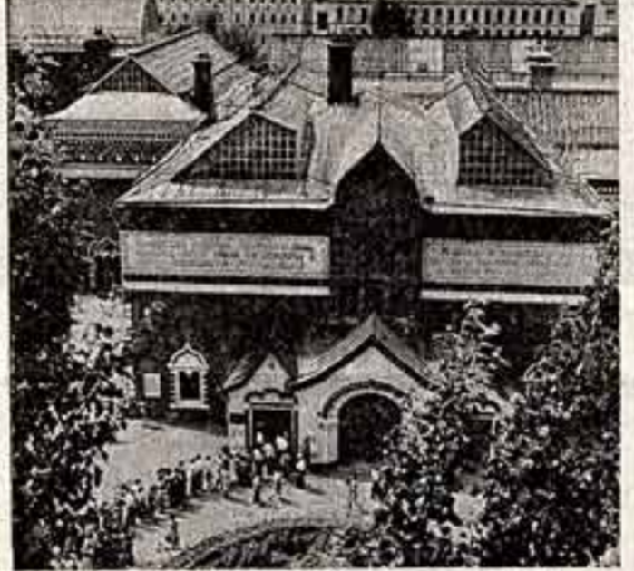
● Русская весна. (Народная артистка СССР Л. Зыкина). ● Лесная гора. (Танцовщицы из ансамбля Северной Осетины А.Алаки). ● Сокращения русского искусства Государственной Третьяковской галереи.