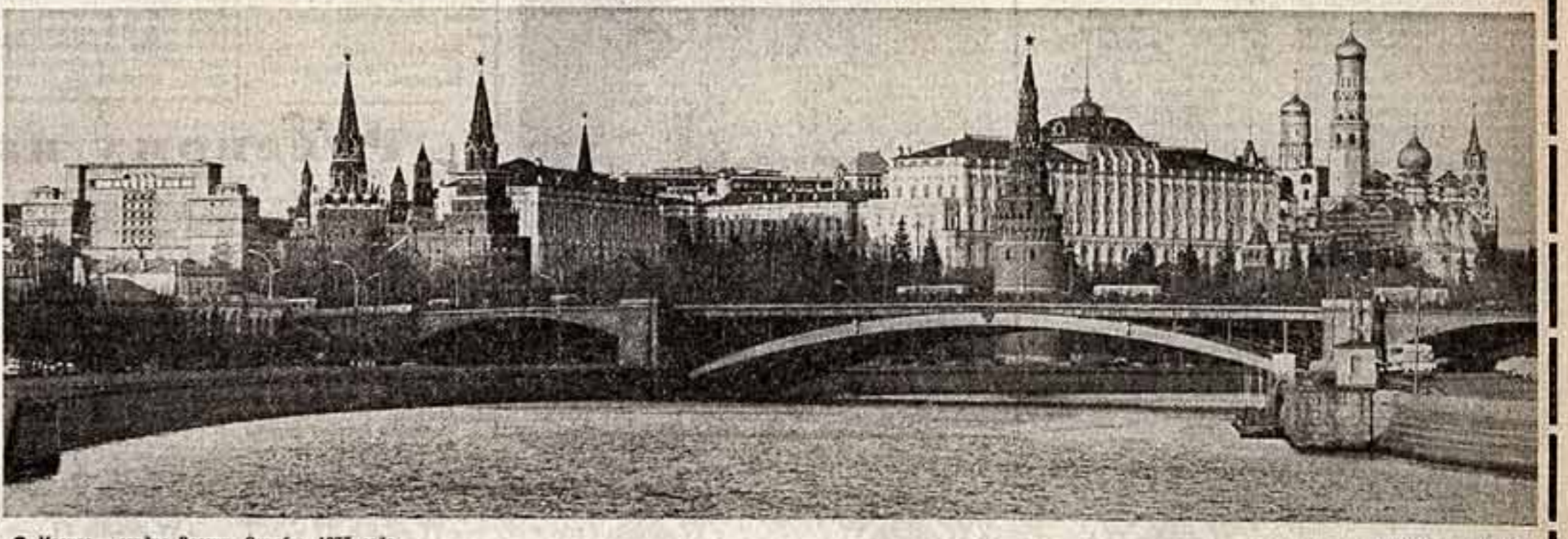
● Москва — сердце России. Октябрь 1977 года.