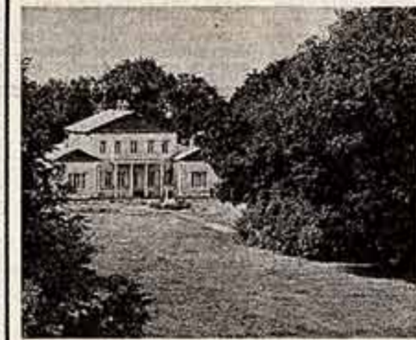
Михайловское, Тарханы, Спасное-Лутовиново — такой глубокий отзвук в сердце находят эти уголки земли русской! Здесь, в тишине, нарушаемой лишь шелестом деревьев, рождались незабвенные строки А. Пушкина, М. Лермонтова, И. Тургенева. Со всех концов страны прискакивают в музейные залы любители портретов, вглядываясь в представленные в литературной экспозиции заветные томики, рукописи, осязая галерею, наполненную вещами, которые окружали писателей. Хочется неслышно пройти по аллеям понарошку осенней антологией, так, чтобы в воображении ярко и зримо явились замечательные с детства литературные образы. В такие минуты особенно остро ощущаешь высокое слово Отечества...

Усадьба-музей И. Тургенева. В Тарханах. Памятник поэту в Пушкинских горах. Рисунок Ю. Смагина.