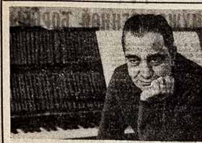
В архиве балета «Девочки Баши», четверть века на сцене со своим тридцатью повторениями...