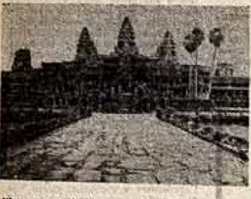
Мемчунина Камбоджи — храм Ангкор-Ват.