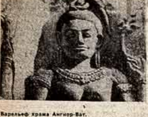
Барельеф храма Ангкор-Ват.