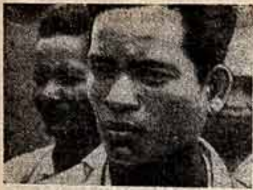
Взгляды злых наблюдателей, совмещающих в разоблачении американского броненосца красноречивые слова...