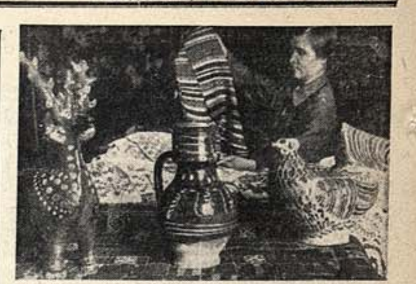
В Харьковской картинной галерее открывается постоянная выставка украинского народного искусства.

«История архитектуры» Том II. Издание подготовлено в 1934 г. Том II. Издание подготовлено в 1934 г. Том II. Издание подготовлено в 1934 г.