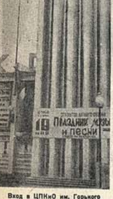
Вход в ЦПКО им. Горького