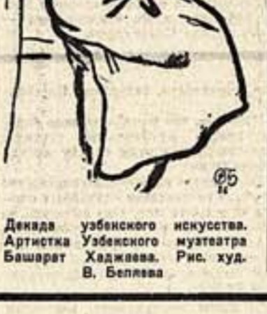
Девка узбекского искусства. Артистка Узбекского мюзетра Башарат Хаджаева. Рис. худ. В. Белышева

«Девка узбекского искусства» Девка узбекского искусства. Артистка Узбекского мюзетра Башарат Хаджаева. Рис. худ. В. Белышева