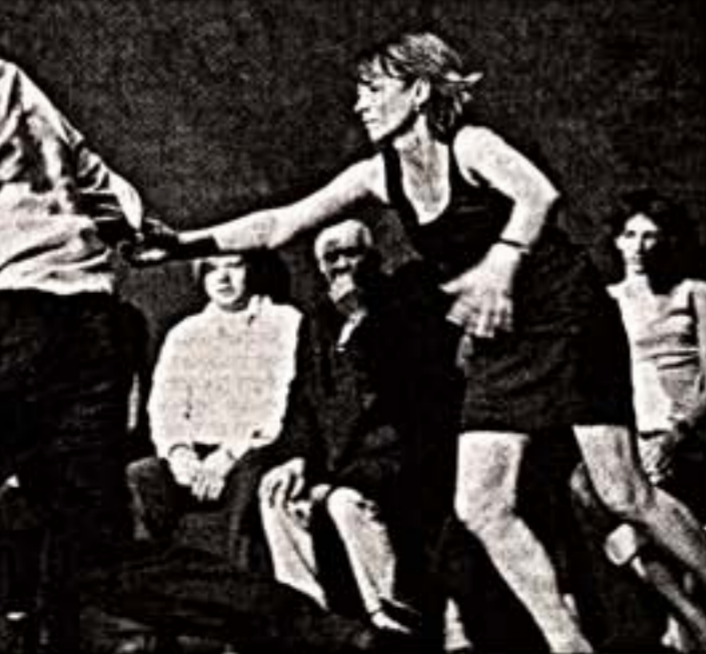
Сцены из спектаклей "Чайка" (слева) и "Свадьба Фигаро"