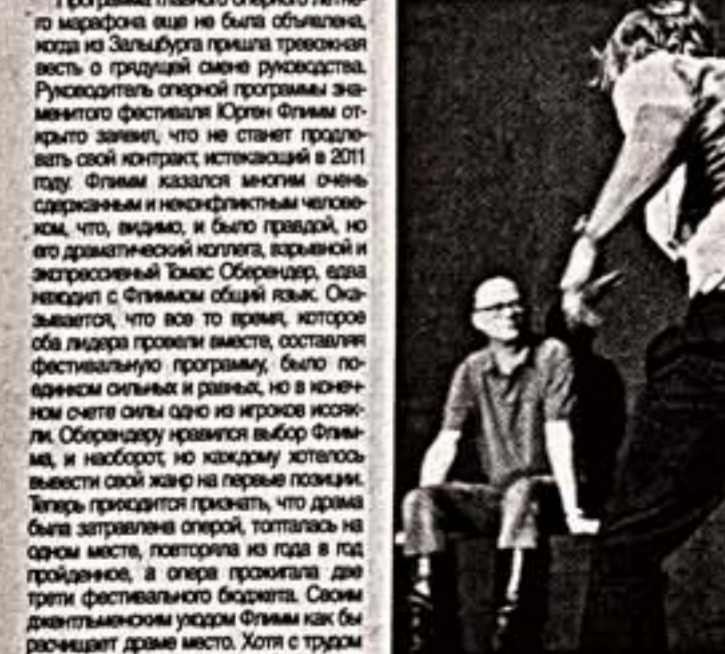
Сцены из спектаклей "Чайка" (слева) и "Свадьба Фигаро"

Послезавтра стартует Зальцбургский фестиваль