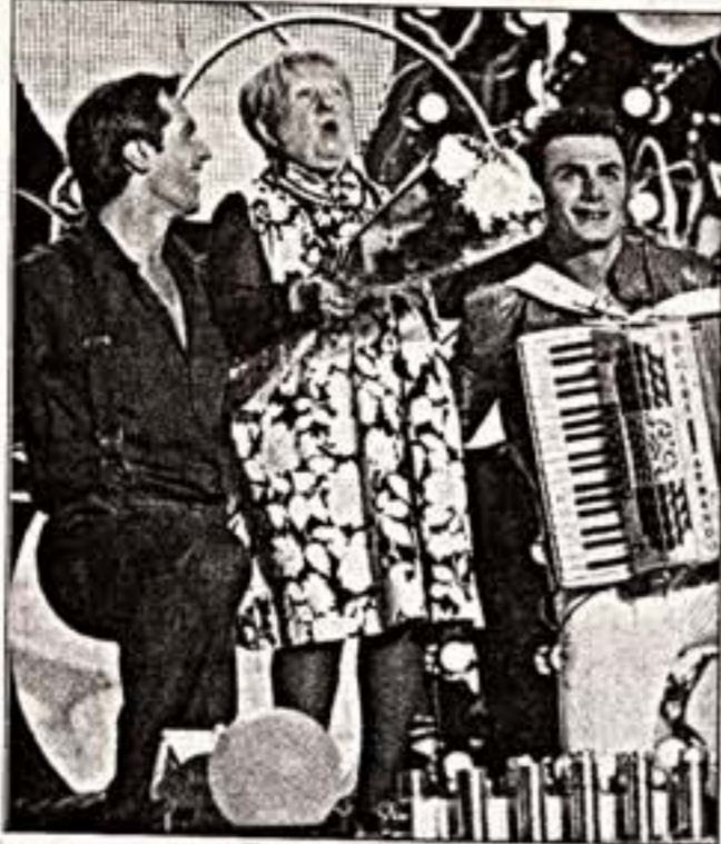
А. Пахмутова в центре мужского внимания