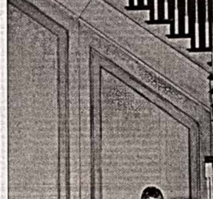
Сцены из спектаклей "Чайка" (слева) и "Свадьба Фигаро"

тально обирают свой любимый фестиваль от экономайских негод. Все идет по плану — никаких призываний и постановки не организовано, не сорвали сроки проведения летнего праздничного. Оно пройдет с 25 июля по 31 августа. Открывает фестиваль премьерой оперы Венделла "Возврат" в постановке Кристофа Лоя.