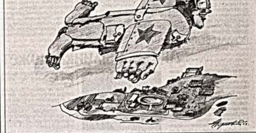
Э. Гороховский. Из цикла "Иллюстрации памяти", 2004 г.

Одним из самых известных британских скульпторов, работающих в традициях классической скульптуры, является Энтони Гормли. Он известен своими масштабными работами, в которых он создает скульптуры из тысяч одинаковых фигур. Его работы часто представляют собой огромные поля из множества маленьких фигур, которые создают ощущение пространства и движения. Гормли использует различные материалы, включая металл, бронзу, гипс и воск. Его работы часто являются частью инсталляций, которые могут занимать большие пространства. Гормли известен своим интересом к теме человеческого существования и его места в мире.