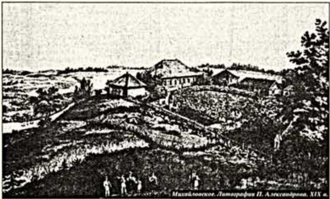
Михайловское. Литорация П.А.Александрова, XIX в.

В самом парке, который теперь с полным основанием можно назвать бышим, дорожки превращены в непролазное месиво из грязи и ломаных корней. Допивают в штабелях полуразрушенные чурки, оставшиеся со времен сильнейшего урагана 1997 года; пниот на корню исполненные дубы, клены и прочие отжившие свой век парковые деревья.