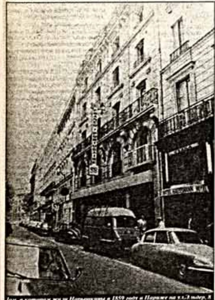
Улица в квартале Сен-Жермен в Париже на ул.С.Давидов.

Буквара еще слышал, — писал впоследствии декабрист Н.И.Лорер, — что он очень дружен с М.М.Нарышкиным, в этого достаточно уже в моих глазах на полную мою симпатию, потому что недостойный человек не может быть другом Нарышкина. Члены тайного общества брали на себя обязательство поддерживать лучшее, углубить свое образование. Находясь в Петербурге в 1818 — 1819 гг., М.М.Нарышкин по вечерам посещал лекции лучших профессоров: политической экономии — Кунца, статистики — Германа, физики — Соловьева.