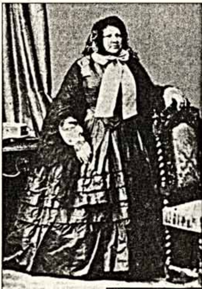
F.N. Нарышкина, Париж, 1859 г.