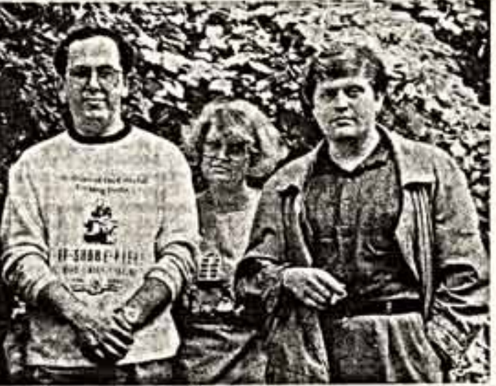
«Высокие люди, продавали желательные им кандидатуры на какие-то партии, и вдруг — отвал».

«Музыка лишь тогда жива, когда ты в ней свободен, когда знаешь, что можешь сделать что-то, чего не можешь в обычной жизни...»