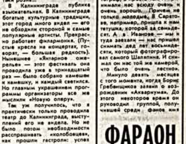
«БГ-бэнд. Это был, как он считает, этромужетный состав. «Новая Опера» уже обвела более двадцати лет городов...»

«Высокие люди, продавали желательные им кандидатуры на какие-то партии, и вдруг — отвал».