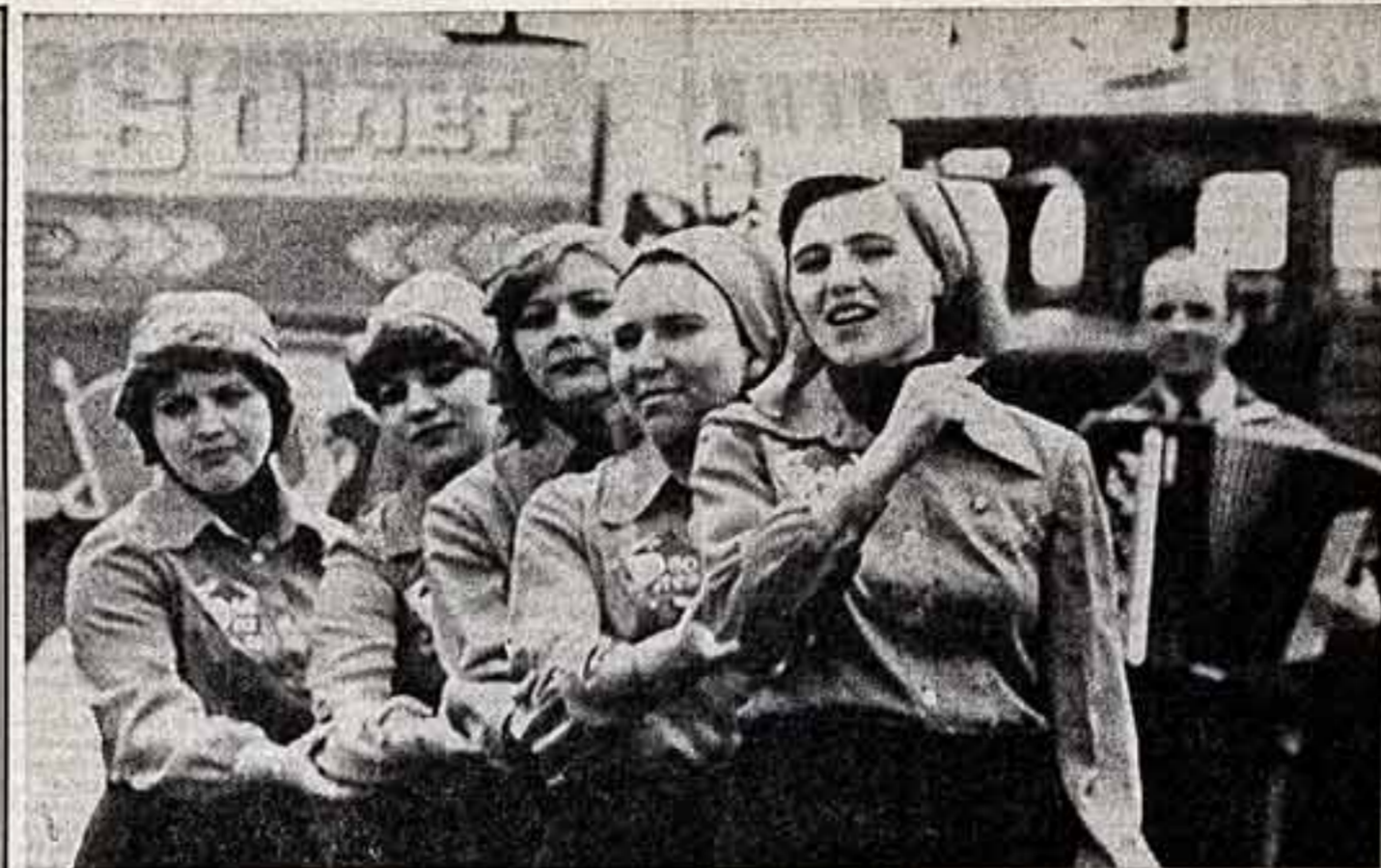
Легитимация Валкалеского районного дома культуры Харьковской области — неоднократный победитель областных смотров. Постоянные выступления перед тружениками сельского хозяйства непосредственно на полях во время посевных и уборочных заставляют коллективы находиться в хорошей творческой форме. А вместе с агитбригадой приезжают на поля и лекторы, и библиотечари.

Выступление на полевом сцене 2-й бригады колхоза имени Ленина.