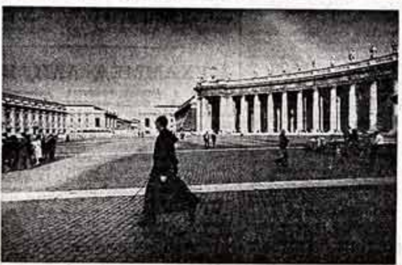
Эти снимки сделаны в Италии. Певец «Интернационала» завершил встречу с представителями Стран Советов...