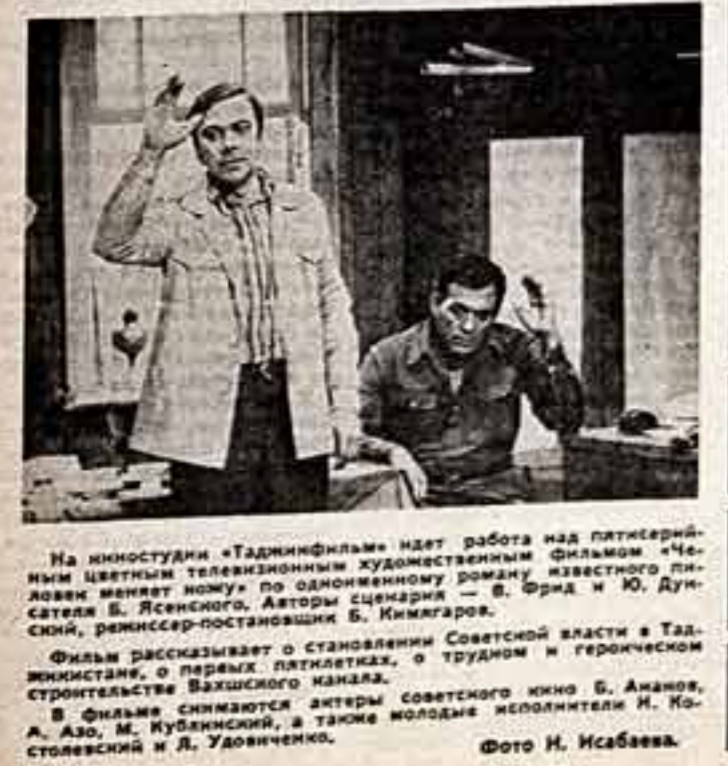
На киностудии «Таджинфильм» идет работа над пятисерийным цветным телевизионным художественным фильмом «Чем цветнее — тем лучше»...