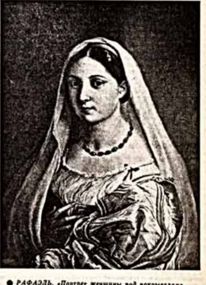
РАФАЭЛЬ. Портрет женщины под покрывалом.