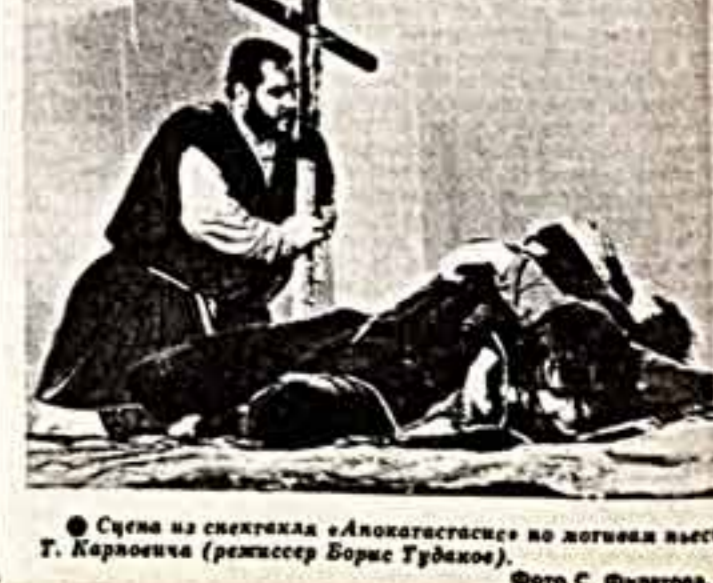
Сцена из спектакля «Апокалипсис» по мотивам пьесы Т. Карловича (режиссер Борис Тудихов).