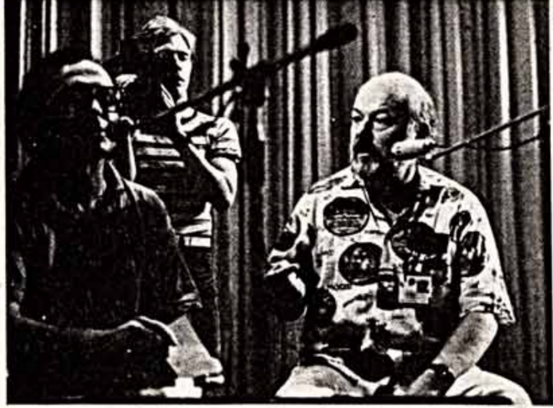
Титл; нет ничего проща — и не пришлось.

«зеленому берегу», который повел себя отважно и благородно, выйдя в одиночку на борьбу с подонками. В конце 60-х мы купили право на показ «Рожденных неприкаянными». Но фильм в прокат так и не вышел. Копии субтитрировали и благополучно положили на полку. Кто-то везлало предрек, что картина спровоцирует насилие и рокирский бум и все падады начнут копировать бандитов (я порой удивляюсь, как вообще в застойные времена добивались до экранов фильмы с «отрицательными» персонажами. Как еще тогдашним ханжам от кино не пришло в голову, что мальчишки станут, не дай бог, подражать батыке Махно, а не жителям неуловимых?). 20-летний арест картины отнюдь не помешал явлению рокиеров на грешной нашей земле. И преступность прискорбно подточила до небес все всякой зависимости от полочных «Подонков» или вообще не приобретенных бестселлеров 60—70-х годов, таких, как «Бонни и Клайд», «Механический апельсин», «Инцидент» или «Удачный ездок» (не пора ли одуматься и купить их наконец, а?). Это я на тему беспорочного нашего ханжества, не изжитого доселе. Но вот о чем еще заставляет задуматься история создания картины... На последнем пленуме правления Союза кинематографистов да в накануне объявлено были результаты тех первых кинофорумов, где прокатчики «прокатили» отечественный кинотовар — оку-