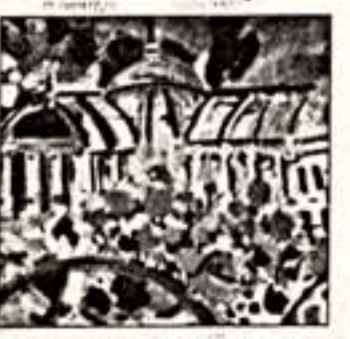
"Гран Пале", 2001 г.

"Вибрации души" французского художника Габриеля Юона Эргина