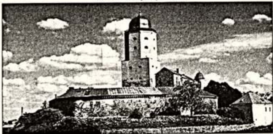
Старейший в России замок Выборга