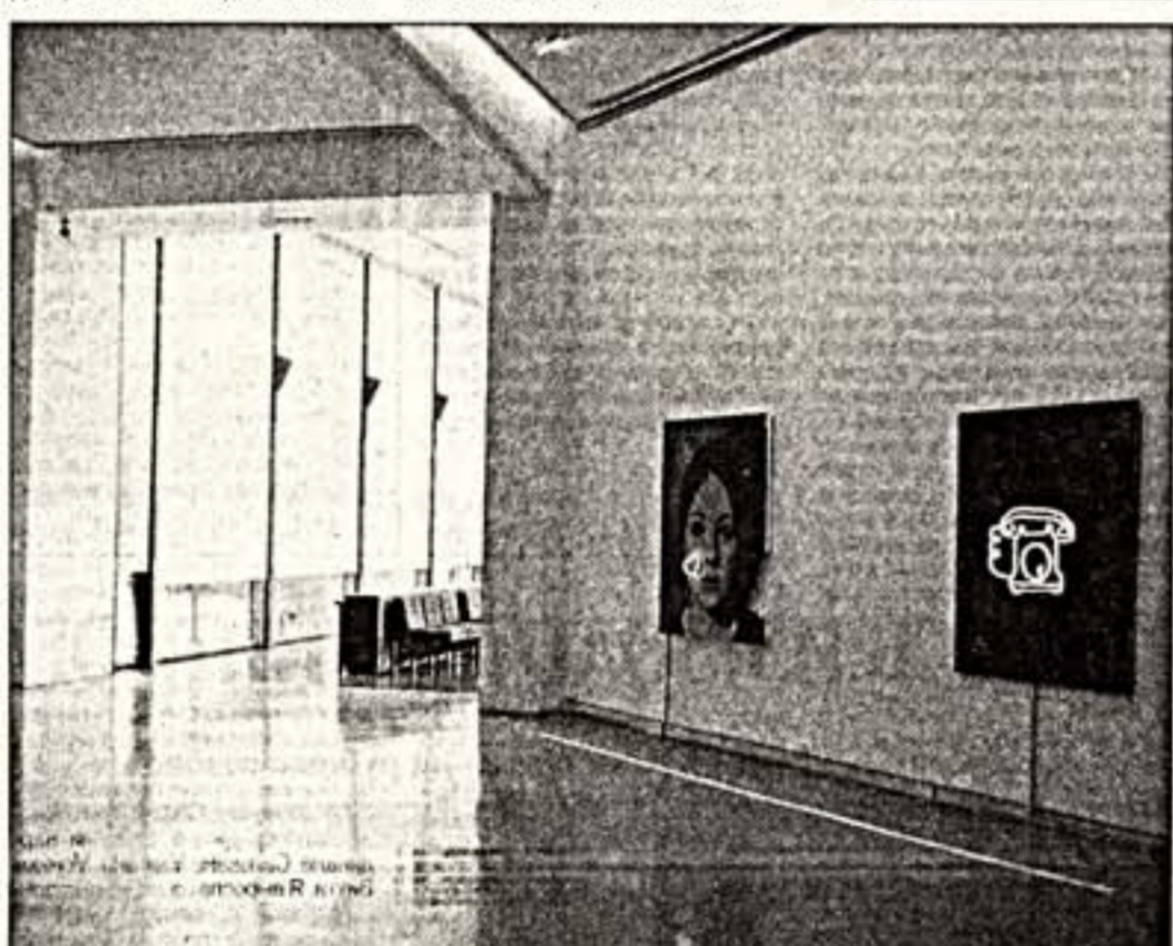
Так экспонируется современное искусство во французской провинции. Залы музея современного искусства в Ницце.