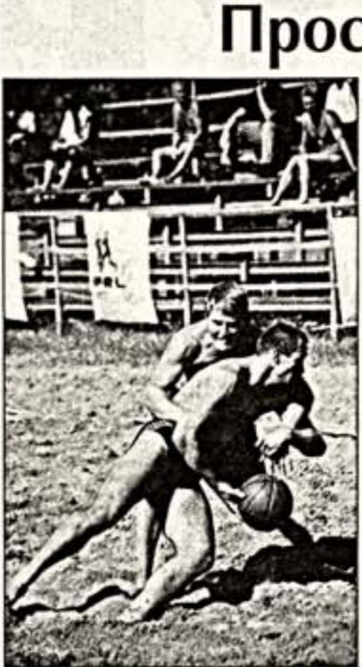
Ребол - новый вид спорта, которому 4 года