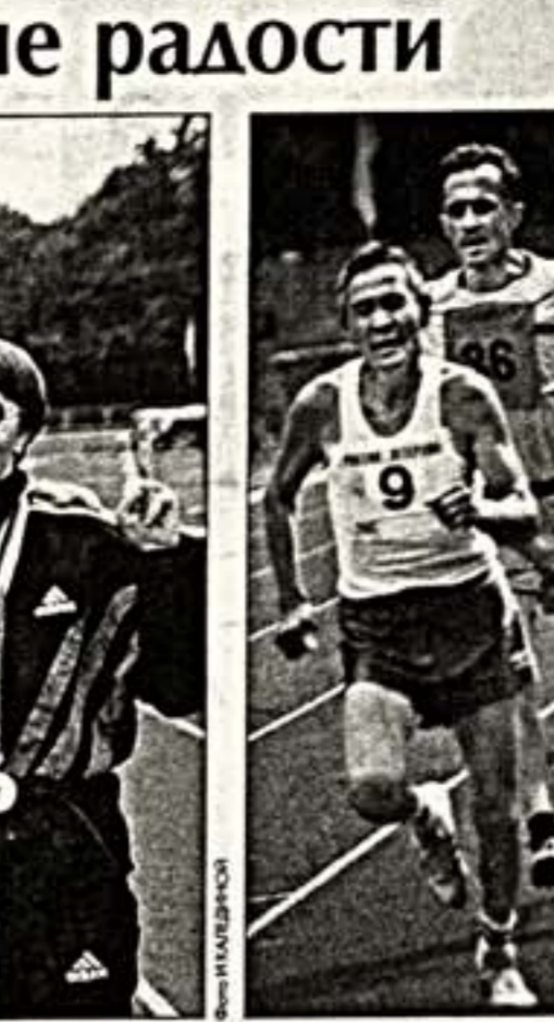
Бег в "Лужниках", которым 45 лет