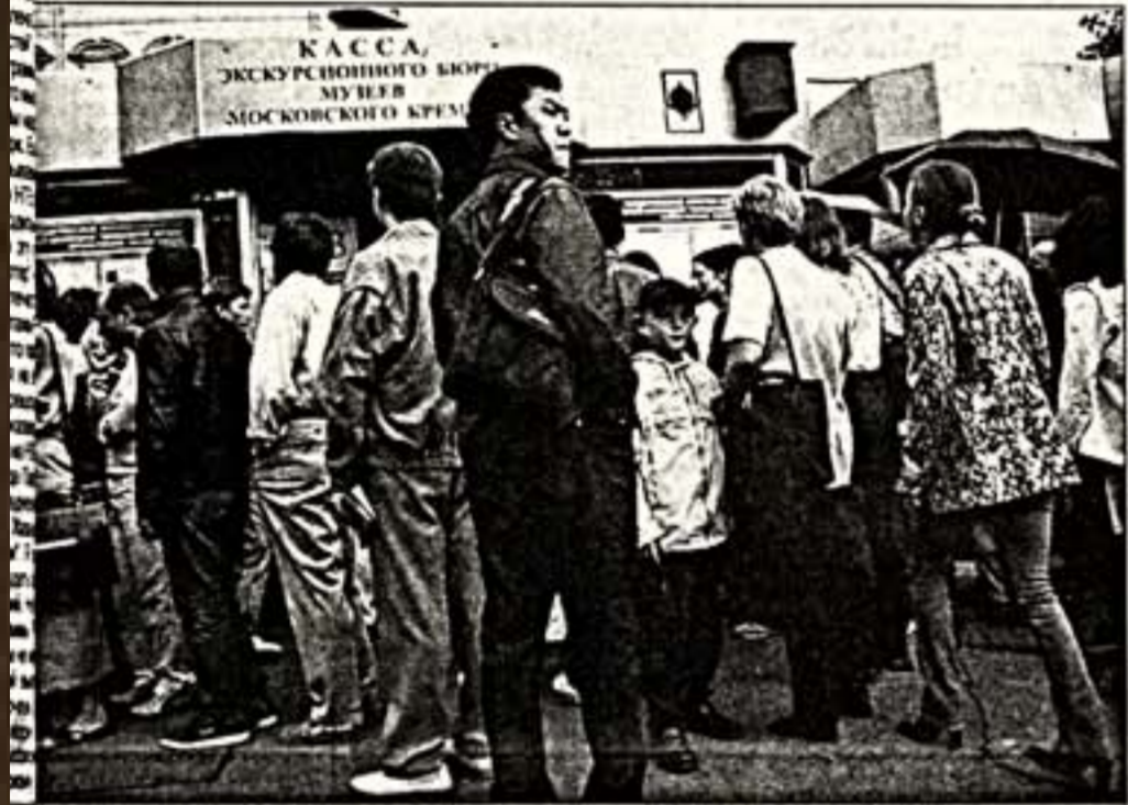
АВТОБУСНЫЕ ЭКСКУРСИИ ПО МОСКВЕ