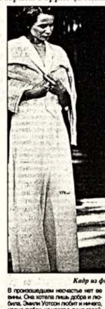
Кадр из фильма Э.Уотсон и Дж.Туртурро