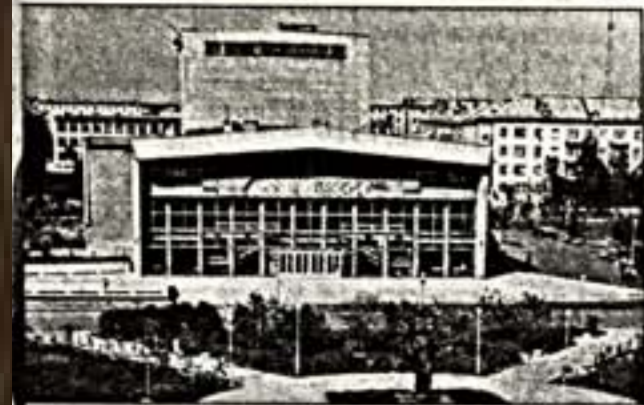
Театр оперы и балета Республики Коми

Оперный театр Республики Коми: юбилейный сезон